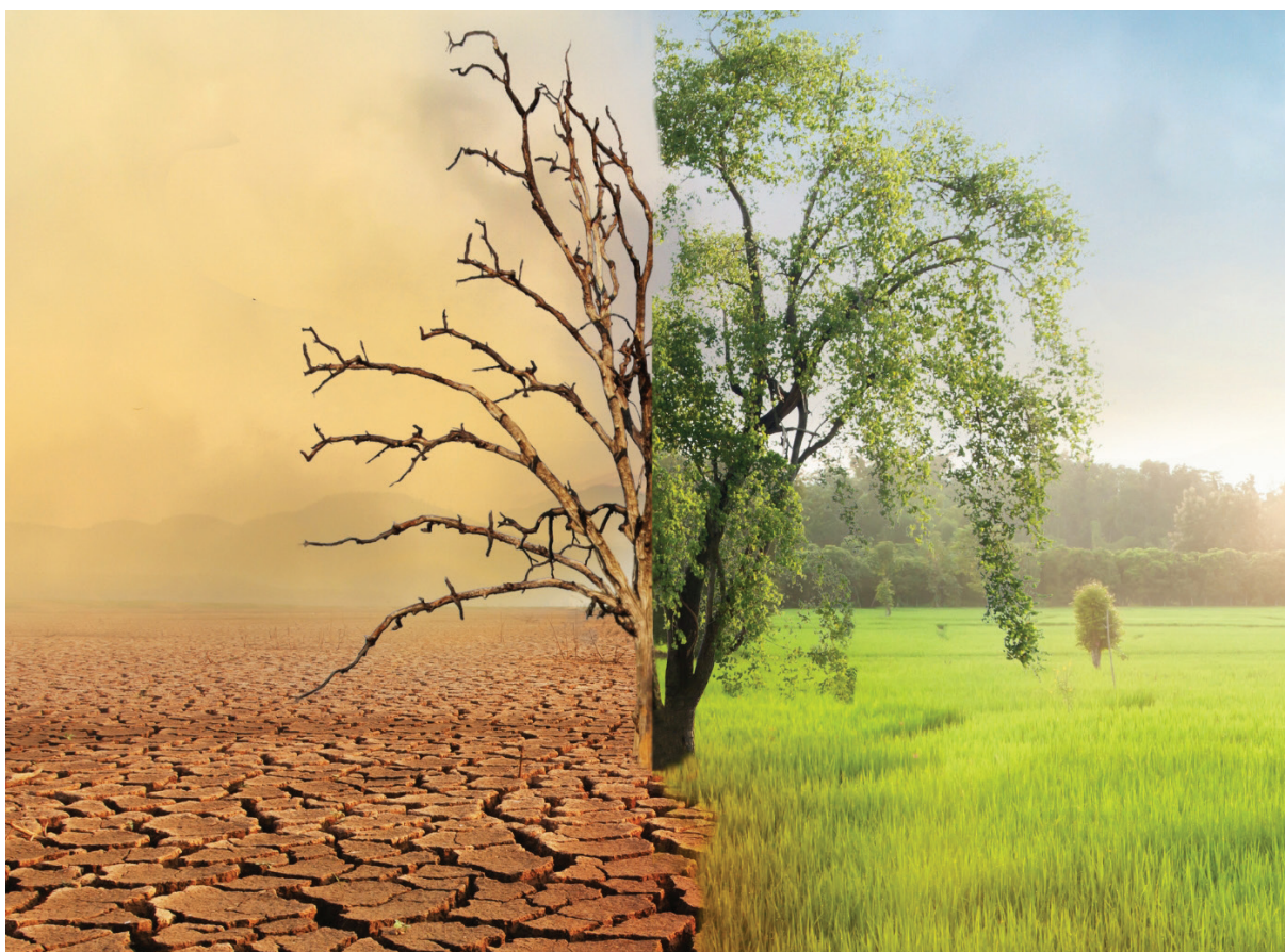
Slovenija si prizadeva za čisto, zdravo in trajnostno okolje

Slovenija kot integralni del celostnega načina obravnave priseljevanja s sodelovanjem v civilnih misijah EU, OZN, Organizacije za varnost in sodelovanje (OVSE) v Evropi aktivno prispeva h krepitvi učin-