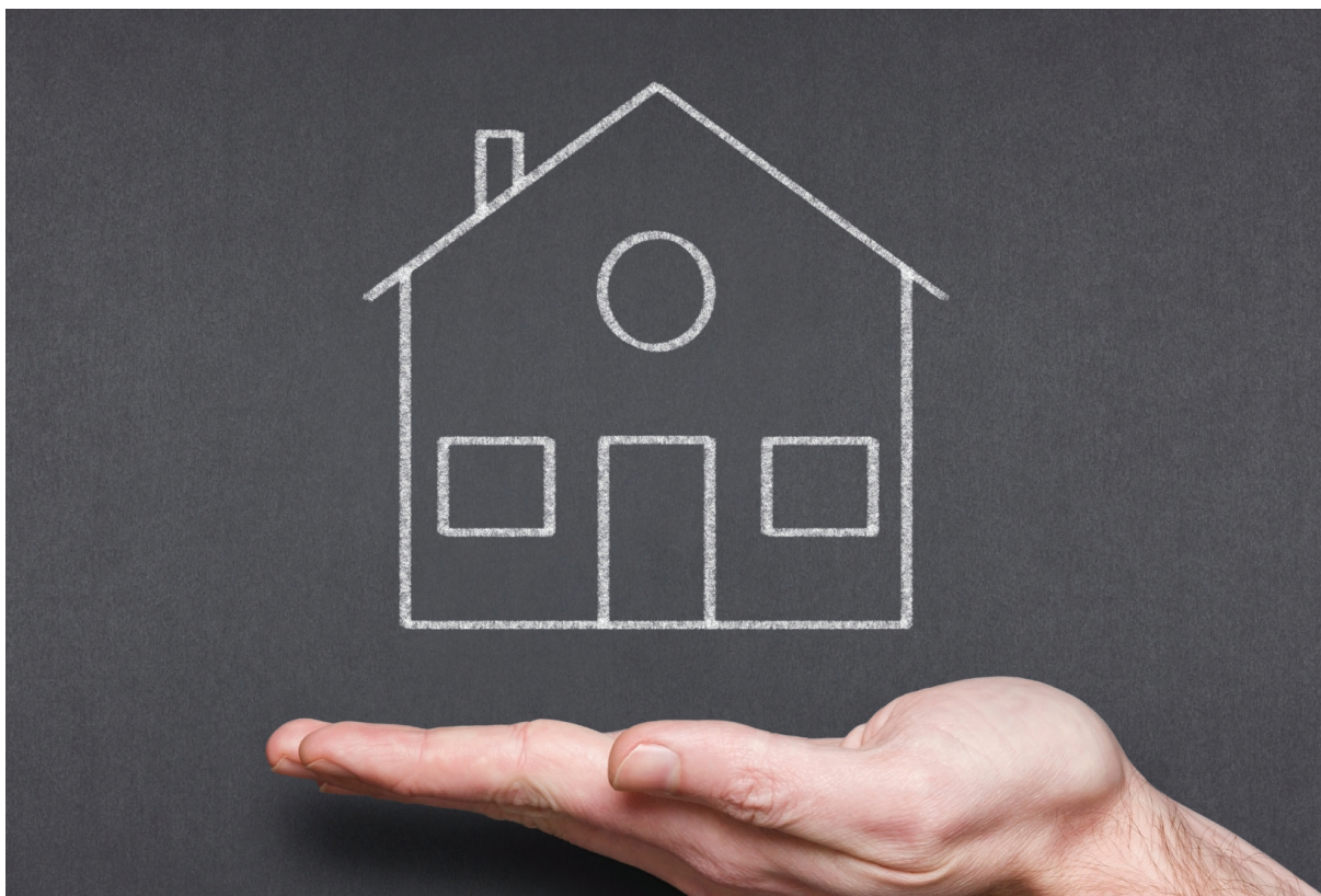
Zagotavljanje zadostnih in ustreznih prostorov za prosilce za mednarodno zaščito

Zagotoviti bo treba tudi dodatne ukrepe za pomoč mladolletnikom brez spremstva ob prehodu v polnoletnost in kasneje. Mladim bi tako morali po vzoru iz tujine omogočiti nastanitev v posebnih prostorih za mladolletnike brez spremstva tudi v njihovem nadaljnjem zelo ranljivem obdobju.