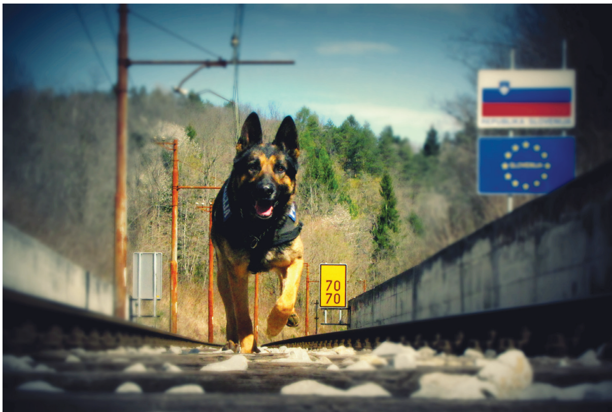
Nadzor državne meje

Pri vračanju bo policija intenzivno sodelovala z agencijo Frontex tako na področju izmenjave izkušenj kot pri usposabljanjih, skupnih operacijah vračanja in identifikacijskih postopkih državljanov tretjih držav.