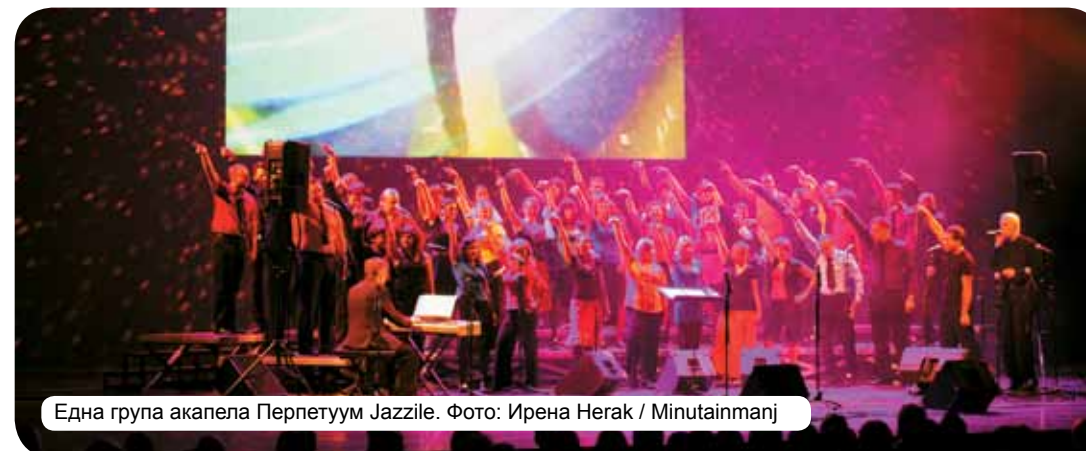
Една група акапела Перпетуум Jazzile.