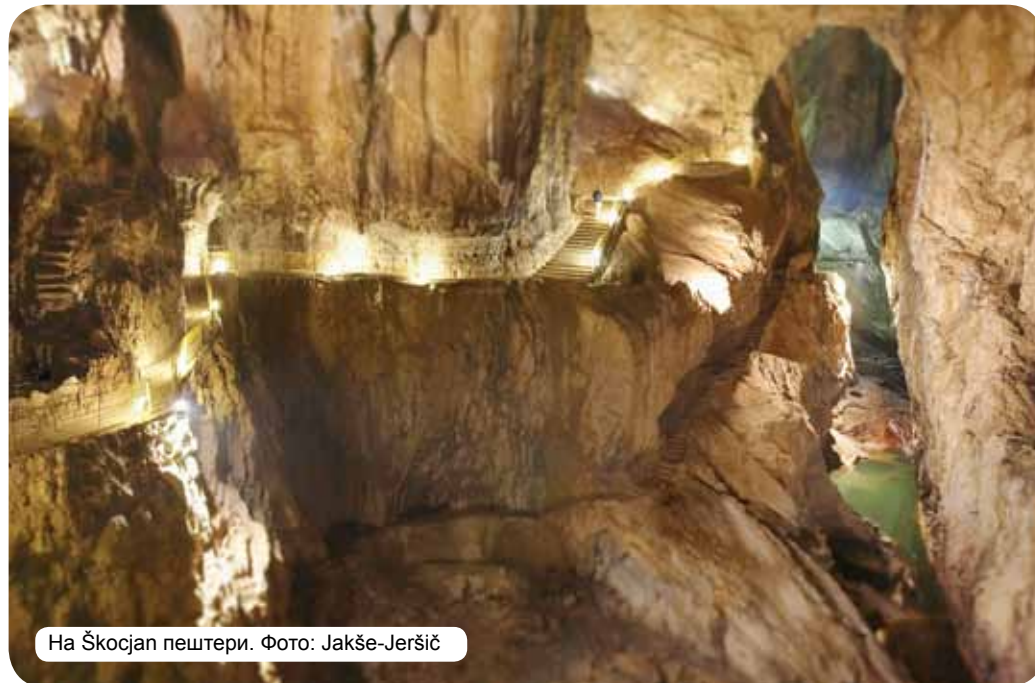
На Škocjan пештери.