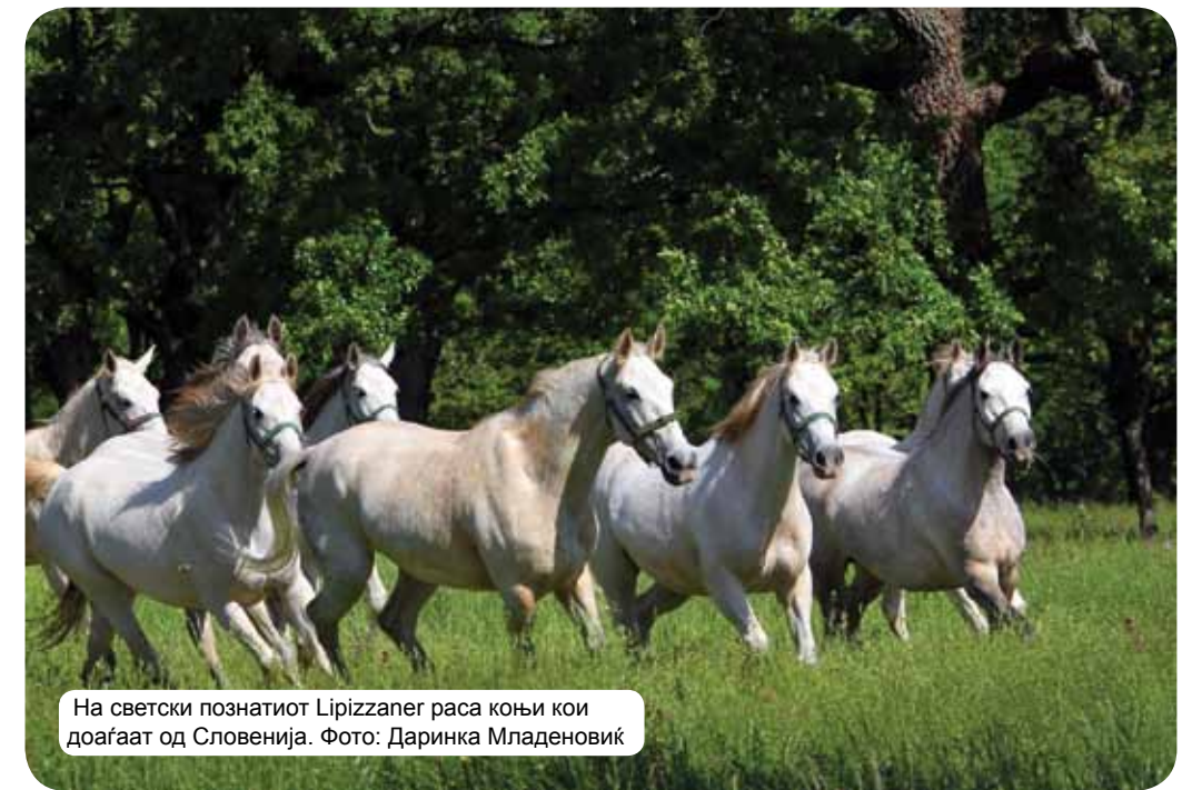
На светски познатиот Lipizzaner rasa коњи кои доаѓаат од Словенија.