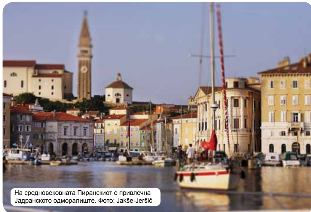
На средновековната Пиранскиот е привлечна Јадранското одморалиште.