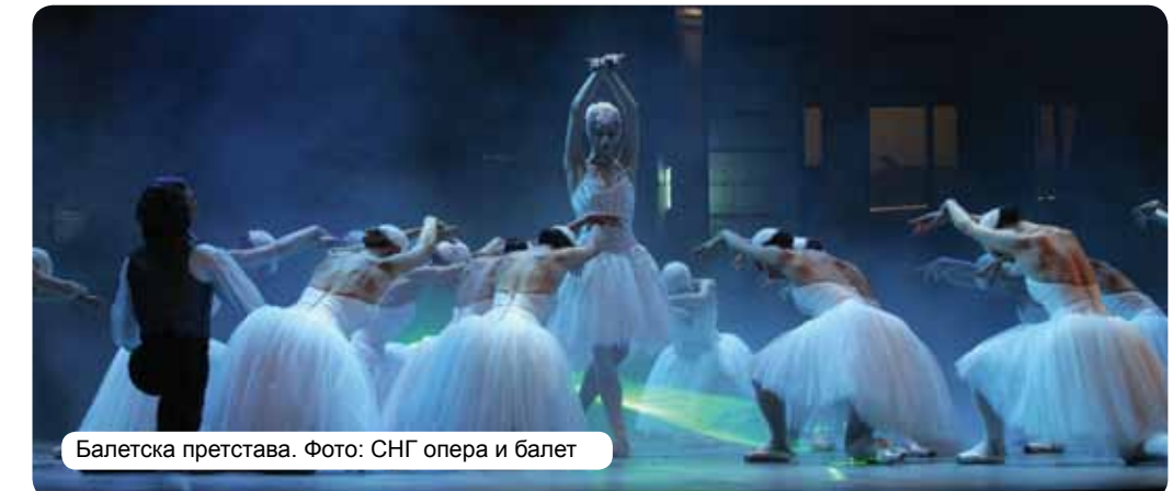
Балетска претстава.