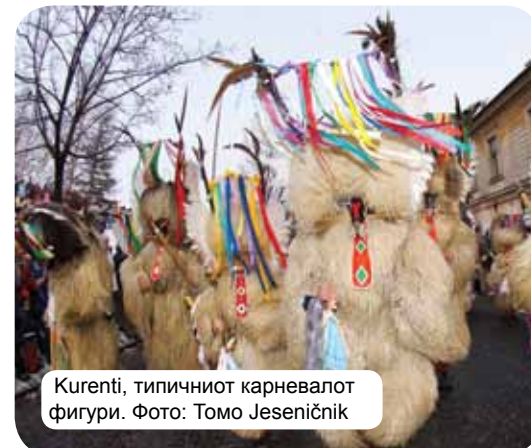
Kurenti, типичниот карневалот фигури.

уметниците со разновидни таленти и вештини кои биле предавани од генерација на генерација, Словенците исто така се успешни и во многу други модерни форми на уметност достапни за сите генерации. Културните настани се неверојатно добро посетени – различни фестивали (посебно во летниот период) кои ги воодушевуваат посетителите од земјата и надвор од неа. Театарот и концертите се популарни, Словенците сакаат да читаат и се горди на нивната културна традиција. Треба да се споменат Франце Прешерн, поет кој постана гордост на Словенечката поезија и автор на Словенечката државна химна, „Zdravljica“ (Здравица). Химната повикува на соживот на народите и е здравица за сите луѓе со добро срце.