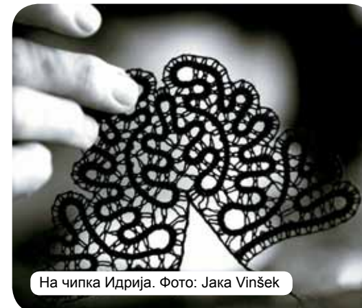
На чипка Идрија. Фото: Јака Vinšek