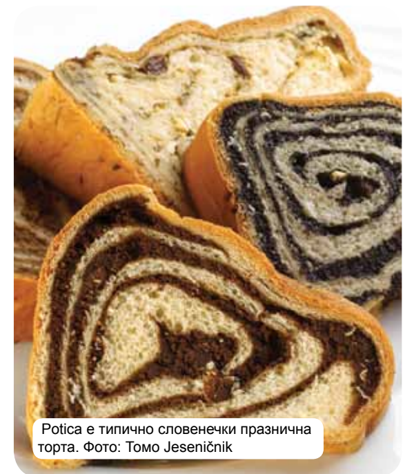
Potica е типично словенечки празнична торта.

Кулинарската слика на модерна Словенија ги инкорпорира влијанијата од културите и цивилизациите од Алпскиот, Медитеранскиот и Панонскиот регион. Векови од општествен и историски развој на овој крстопат создале посебен вид на култура и стил на живот, не во смисла на асимилација, туку во смисла на создавање на уникатна и оригинална разновидност, вклучувајќи го и кулинарството. Традиционалната словенечка кујна се базира на житарици, свежи млечни производи, месо, риба, зеленчук, компир, маслини и пршута. Зависно од регионот, се разбира, здружува влијанија од околната, градовите и различни монашки редови. Покрај кујната, исклучителната разновидност на Словенечки вина обезбедува вистинско гурманско уживање. Комплетните хедонисти ги очекуваат и термални бањи и спа центри, понудата на туристички фарми и извонредни ресторани.