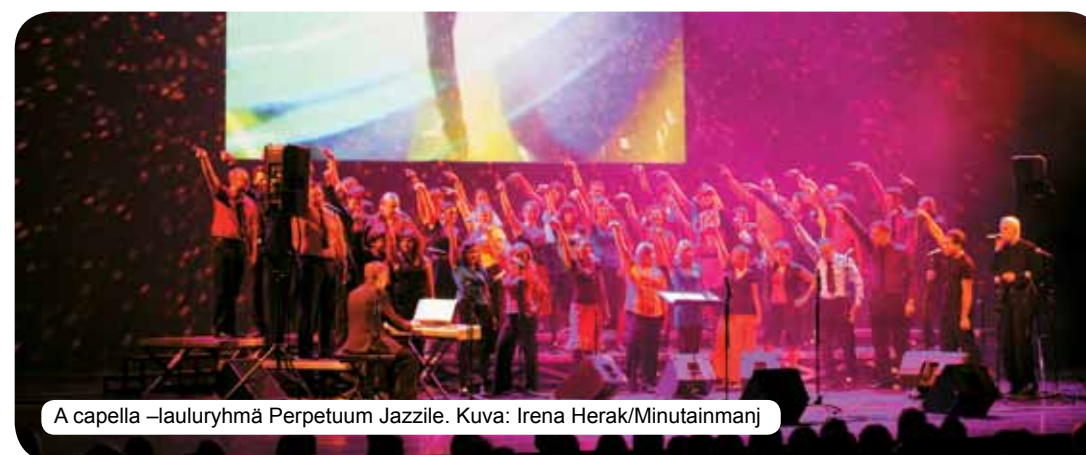
A capella –lauluryhmä Perpetuum Jazzile.