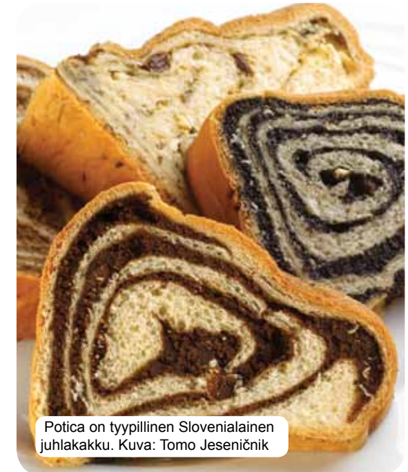
Potica on tyypillinen slovenialainen juhlakakku.

Nykypäivän Slovenian ruokakulttuurissa yhdistyvät alppien, välimeren ja Pannonian alueen vaikutelmat. Vuosisatojen sosiaalinen ja historiallinen kehitys on luonut erilaisia kulttuureja ja elämäntyyliä, jotka ovat ainutlaatuisia ja alkuperäisiä. Perinteinen slovenialainen keittiö perustuu viljatuotteisiin, tuoreisiin maitotuotteisiin, lihaan, kalaan, kasviksiin, perunaan, oliiveihin ja savukinkkuun. Siinä fuusioituu maaseudun, kaupunkien ja erilaisten munkkikuntien vaikutelmia. Ruuan ohella slovenialaisten viinien monipuolisuus varmistaa huippuluokan gourmet-elämyksen. Hedonistit voivat nauttia kuumista lähteistä, parantoloista, turistimaatiloista ja huippuluokan ravintoloista.