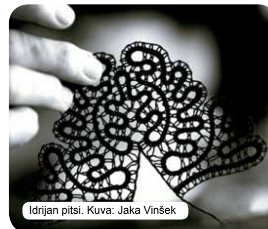
Idrijan pitsi.