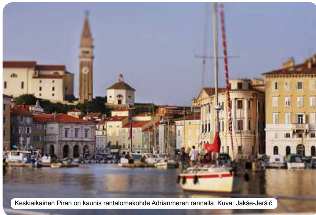
Keskiaikainen Piran on kaunis rantalomakohde Adrianmeren rannalla.