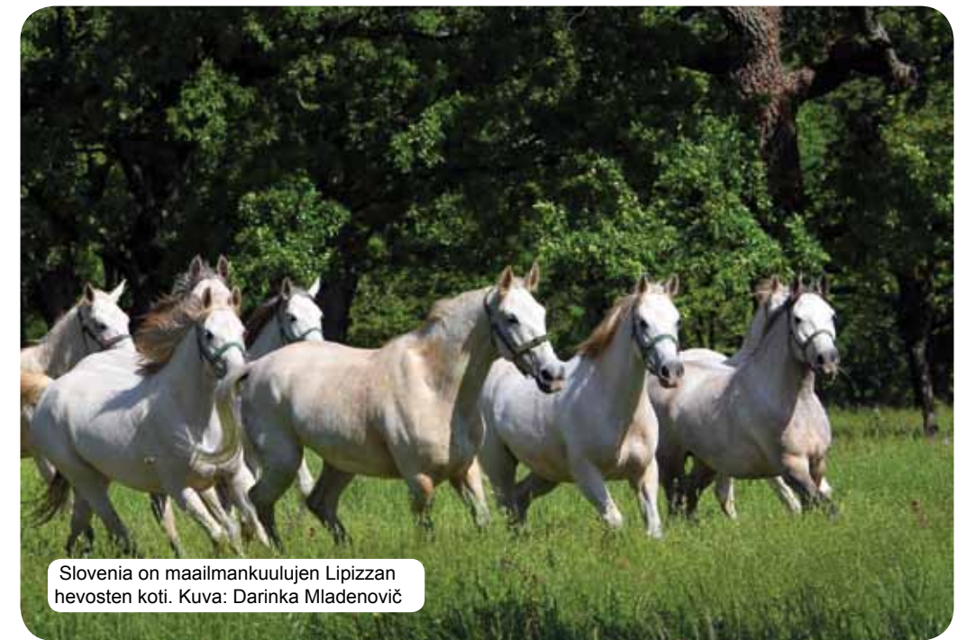
Slovenia on maailmankuulujen Lipizzan hevosten koti.