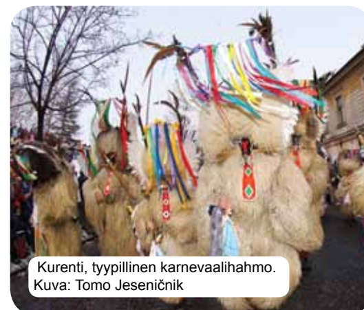
Kurenti, tyypillinen karnevaalihakmo.

viinintekijöitä, muusikkoja, ohjaajia, näyttelijöitä, bloggaajia tai kaivertajia. He luovat taidetta kaikesta rakastamastaan. Sukupolvelta toiselle periytyneitä taitoja ja perinteitä hyödyntävien taiteilijoiden lisäksi on Slovenialaiset ovat saavuttaneet menestystä myös monissa nykyaikaisen ilmaisumuodoissa. Kulttuuritapahtumien yleisömäärät ovat uskomattomia – erilaiset festivaalit (erityisesti kesäkuukausina) viihdyttävät läheltä ja kaukaa tullutta yleisöä. Teatteri ja konsertit ovat suosittuja, slovenialaiset lukevat paljon ja ovat ylpeitä kulttuuriperinnöstään. Yksi suurista on runoilija France Prešeren, joka sanoitti Slovenian kansallislaulun Zdravljican. Kansallislaulu puhuu valtioiden yhteiselon puolesta ja se on zdravljica eli maljapuhe kaikille hyväsydämisille ihmisille.