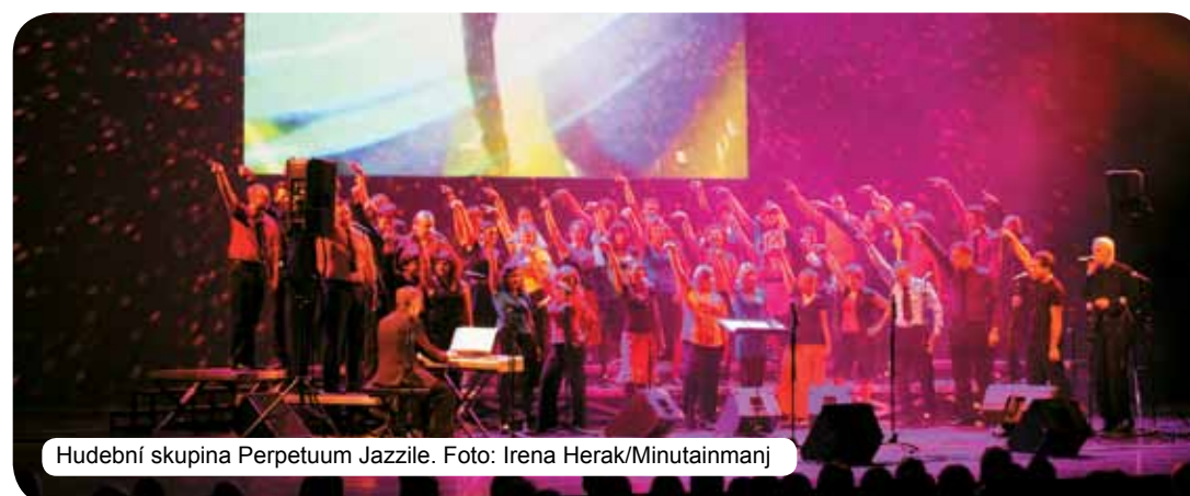
Hudební skupina Perpetuum Jazzile.