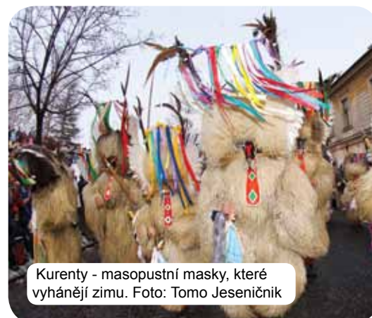
Kurenty - masopustní masky, které vyhánějí zimu.

udělat umění. Kromě umělců různých ručních prací a femesel, která se již přes století přenáší z generací na generaci, jsou Slovinci úspěšní také ve mnoha soudobých uměních, přístupných všem generacím. Kulturní události jsou neuvěřitelně dobře navštěvovány – různé festivaly (ještě obzvláště v letních měsících) nadchnou návštěvníky, kteří přicházejí zblízka i zdaleka. Oblíbená jsou divadla, koncerty, rádi čteme a jsme pyšní na svou kulturní tradici. Zmínit můžeme France Prešerna, básníka, který se stal pýchou slovinské poezie a je autorem slovinské hymny Zdravljice. Ta vyzývá k soužití národů a je oslavou všech lidí dobrého srdce.