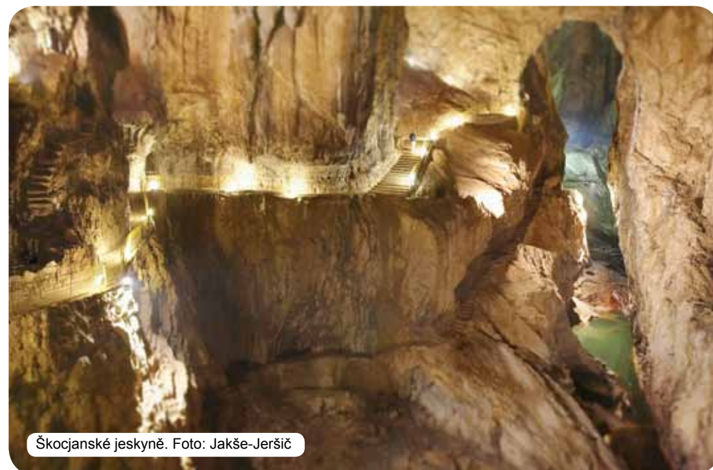
Skocjanske jeskyně.