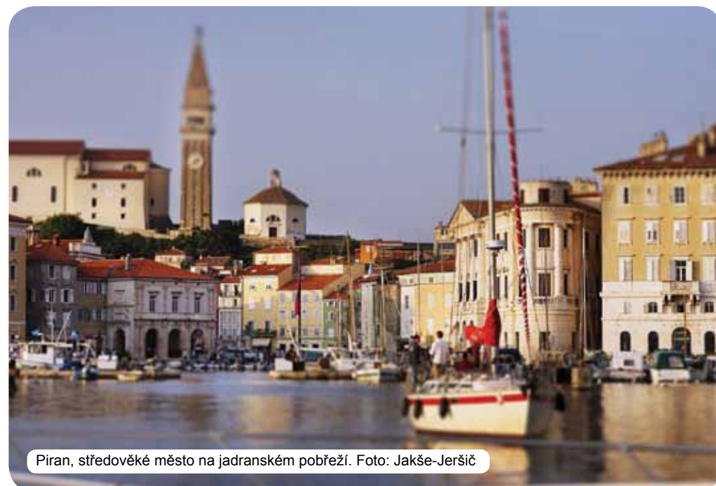
Piran, středověké město na jadranském pobřeží.