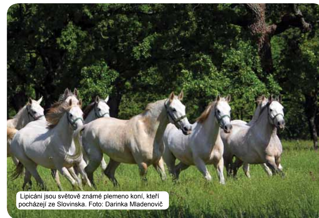
Lipicani jsou světově známé plemeno koní, kteří pocházejí ze Slovinska.