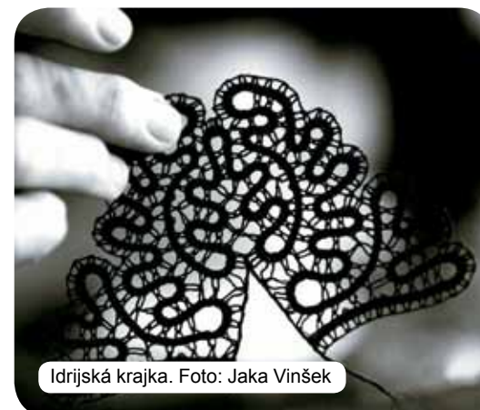
Idrijská krajka.