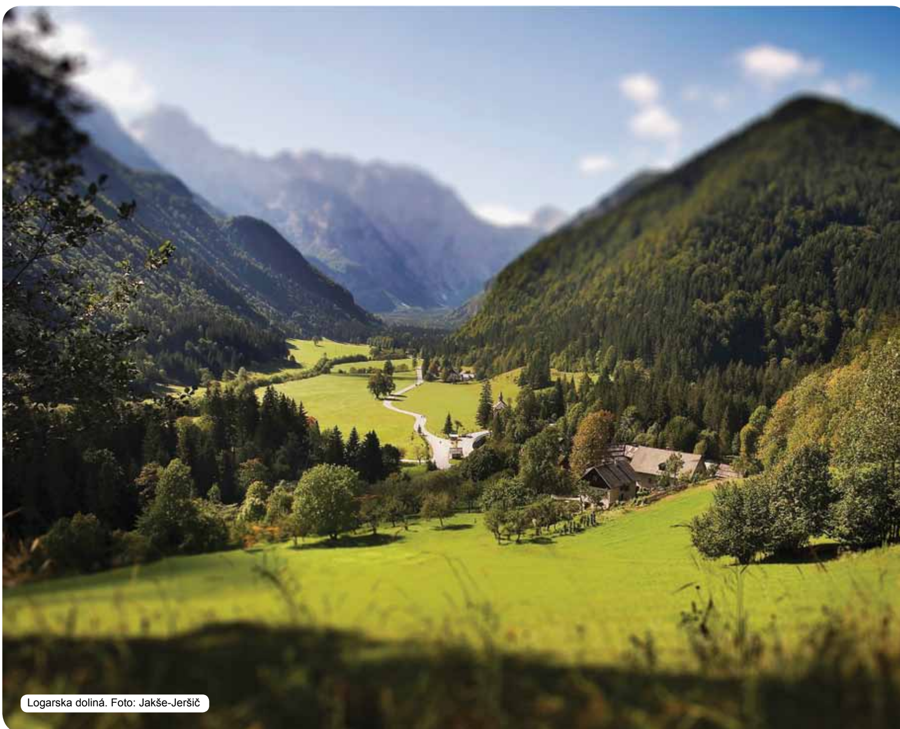
Logarska dolina.

A co se bude nejvíce líbit cizincům, kteří navštíví Slovinsko? Nejdříve jsou to výrazy nadšení. Následují odpovědi, že je Slovinsko příjemný stát, který zklidňuje mysl a dobíjí tělo, především díky své nedotčené přírodě, milému podnebí, pohostinosti, laskavým lidem a mnohým termálním pramenům. Rádi doplní, že je velikost Slovinska právě v bohatosti odlišností, v hodnotách, které vznikaly během století ve spolupráci člověka s přírodou, a že je Slovinsko spořádaný, moderní a bezpečný stát. Není důvod, abyste jim nevěřili.