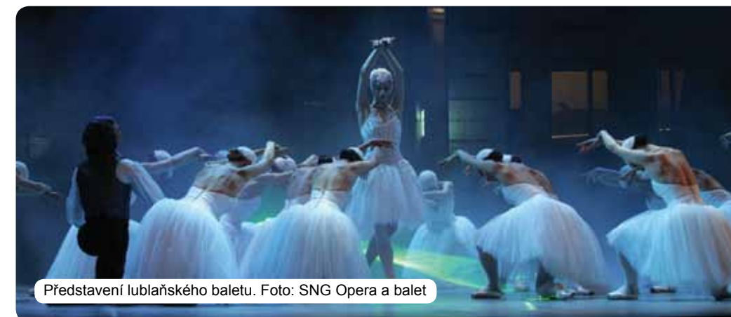
Představení lublaňského baletu.