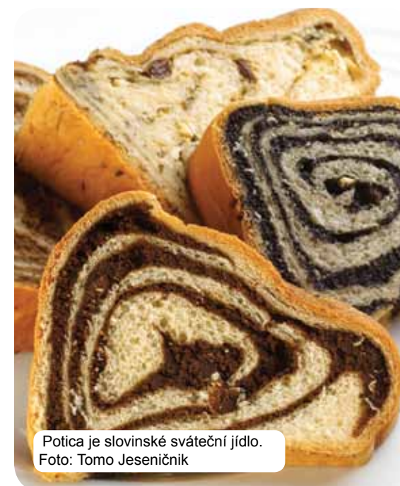
Potica je slovinské sváteční jídlo.

Tradiční slovinská kuchyně je založena na obilí, čerstvých mléčných výrobcích, mase, rybách, zelenině, bramborech, olivách a pršutu. V závislosti na regionu, samozřejmě, sdružuje vlivy venkova, měšťanstva a různých mnišských řádů. Kromě kulinářské nabídky také vyjimečně pestrá nabídka slovinských vín zaručuje vrcholné gurmánské zážitky. Úplně požitkáře ještě čekají termální prameny a lázně, nabídka turistických farem a exkluzivní restaurace.