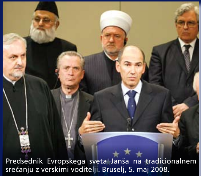
Predsednik Evropskega sveta Janša na tradicionalnem srečanju z verskimi voditelji. Bruselj, 5. maj 2008.