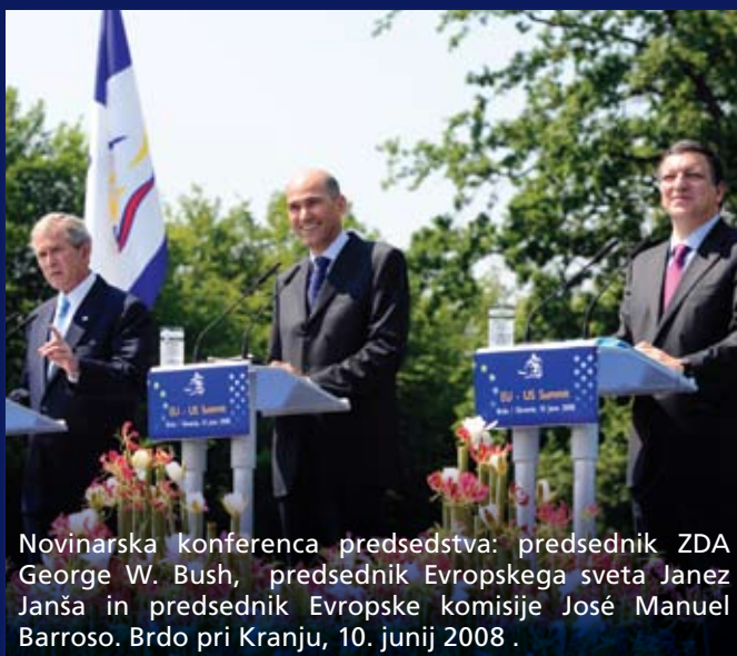
Novinarska konferenca predsedstva: predsednik ZDA George W. Bush, predsednik Evropskega sveta Janez Janša in predsednik Evropske komisije José Manuel Barroso. Brdo pri Kranju, 10. junij 2008.