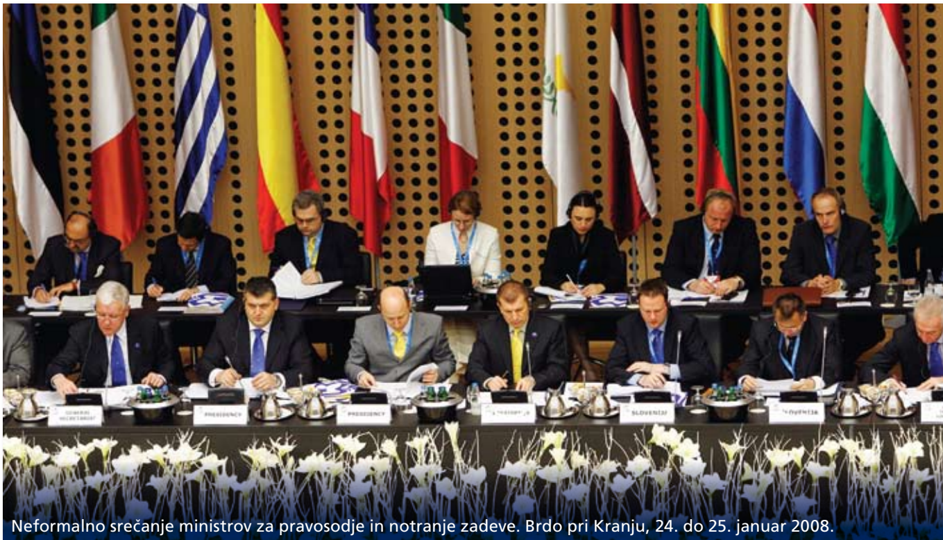
Neformalno srečanje ministrov za pravosodje in notranje zadeve. Brdo pri Kranju, 24. do 25. januar 2008.

izvajanju dogovorjenih skupnih načel o prožni varnosti kot enega ustreznih pristopov k soočanju z izzivi 21. stoletja, med drugim demografskimi spremembami, pospešenim tehnološkim napredkom in procesom globalizacije. Naš osrednji poudarek je bil na izboljšanju položaja mladih , prispevali smo tudi k evropski razpravi o demografskih izzivih ter k sprejemanju ukrepov na področju enakosti spolov.