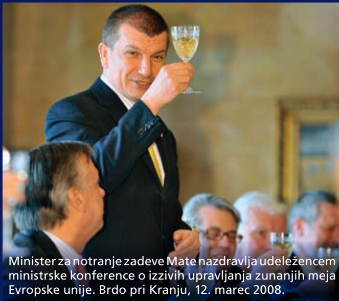
Minister za notranje zadeve Mate nazdravlja udeležencem ministrske konference o izzivih upravljanja zunanjih meja Evropske unije. Brdo pri Kranju, 12. marec 2008.