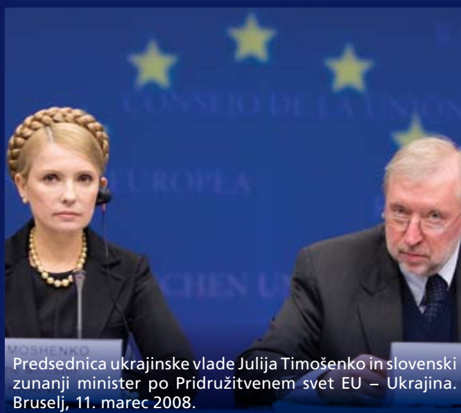
Predsednica ukrajinske vlade Julija Timošenko in slovenski zunanji minister po Pridružitvenem svet EU – Ukrajina. Bruselj, 11. marec 2008.