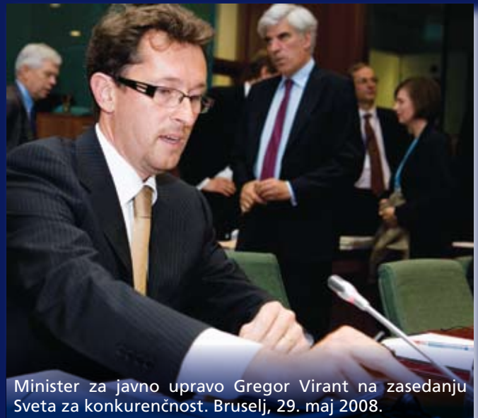
Minister za javno upravo Gregor Virant na zasedanju Sveta za konkurenčnost. Bruselj, 29. maj 2008.