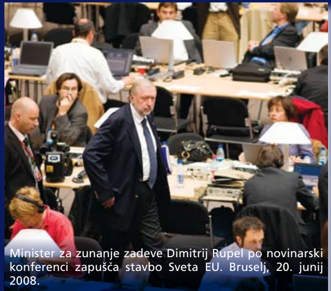
Minister za zunanje zadeve Dimitrij Rupel po novinarski konferenci zapuša stavbo Sveta EU. Bruselj, 20. junij 2008.