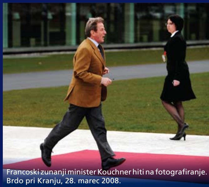
Francoski zunanji minister Kouchner hiti na fotografiranje. Brdo pri Kranju, 28. marec 2008.