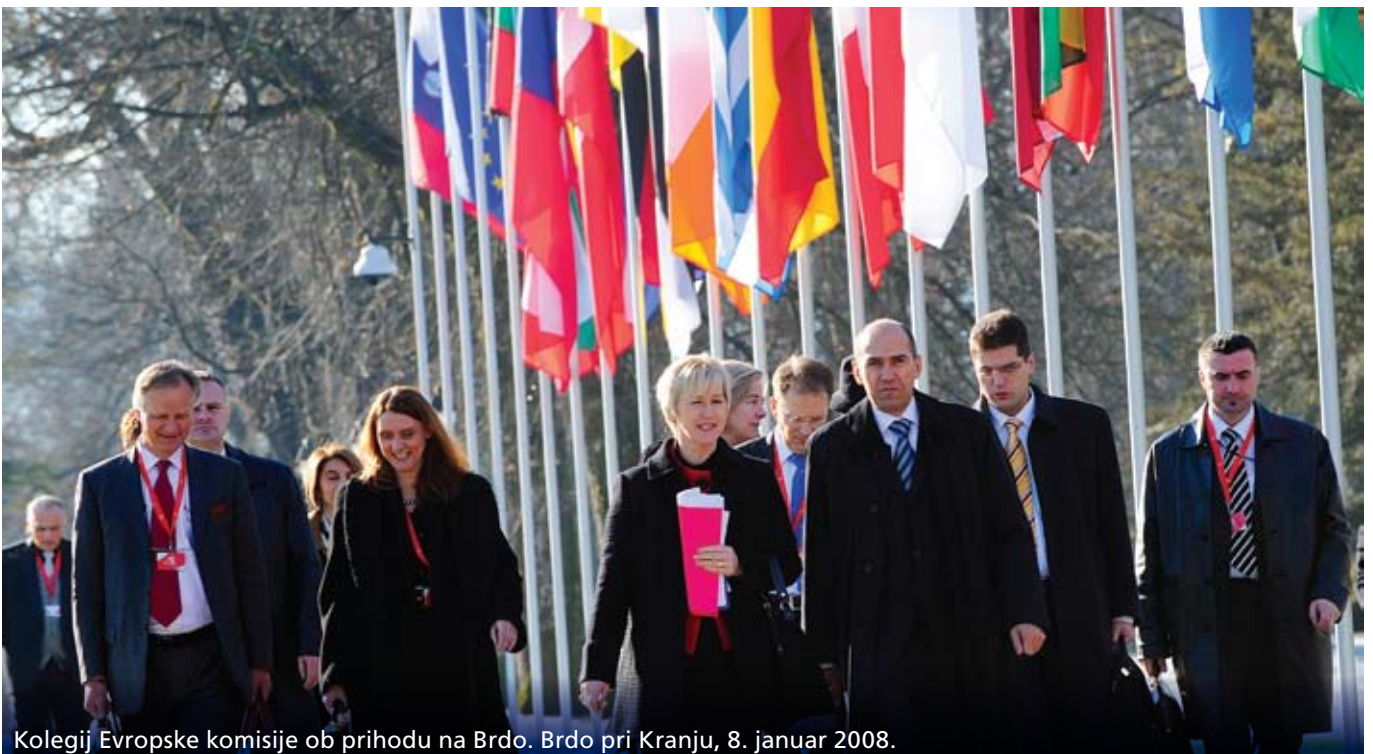
Kolegij Evropske komisije ob prihodu na Brdo. Brdo pri Kranju, 8. januar 2008.

Za konec torej lahko rečemo, da je slovensko predsedovanje poleg bolj intenzivnih stikov slovenskih NVO z nevladnimi organizacijami iz Bruslja in organizacijami drugih držav članic ter iz evropske sosesčine, spodbudilo tudi dobre prakse tesnejšega sodelovanja med predstavniki vlade in nevladnimi organizacijami. Spodbudilo je tudi večjo pozornost medijev in same nevladne organizacije motiviralo k večjemu angažiranju na področju EU zadev. Vsekakor pa smo z razvojem dobrih praks komuniciranja in vključevanja civilne družbe v času predsedovanja postavili standarde, ki bodo lahko za vzgled tudi naslednjim predsedovanjem.