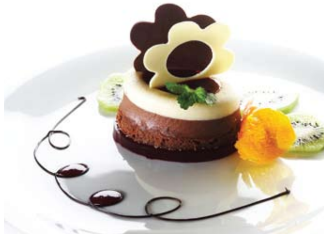
Dvobarvni čokoladni desert.

raziskoval Bližnji vzhod. Ko se vrne, pa se bo spet lahko bolj posvetil slovenski mladinski kuharski reprezentanci, ki jo že več let vodi in ki je ob zahtevnih gostih v času slovenskega predsedovanja EU morala pol leta ostati malce v ozadju.