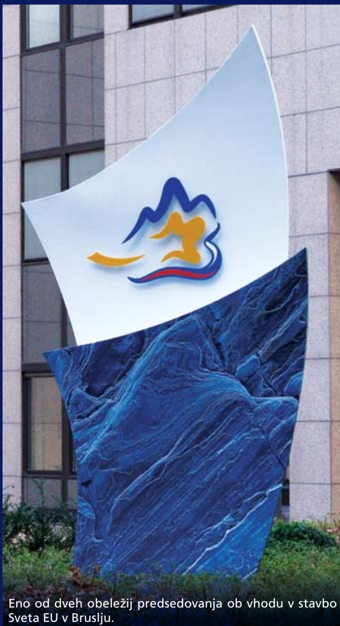
Eno od dveh obeležij predsedovanja ob vhodu v stavbo Sveta EU v Bruslju.