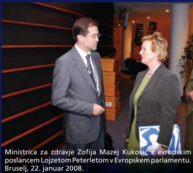
Ministrica za zdravje Zofija Mazej Kukovič z evropskim poslancem Lojzeto Peterletom v Evropskem parlamentu. Bruselj, 22. januar 2008.