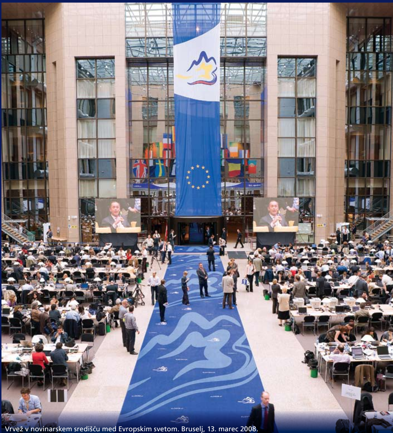
Vrvež v novinarskem središču med Evropskim svetom. Bruselj, 13. marec 2008.

V priložnostni razstavi ob koncu predsedovanja smo predstavili fotografske utrinke o dogodkih in ljudeh, ki so zaznamovali slovensko predsedstvo Svetu EU.