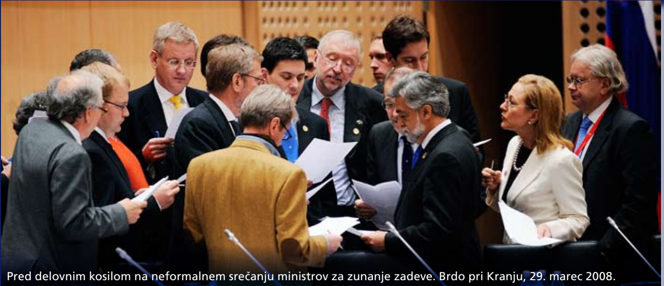
Pred delovnim kosilom na neformalnem srečanju ministrov za zunanje zadeve. Brdo pri Kranju, 29. marec 2008.