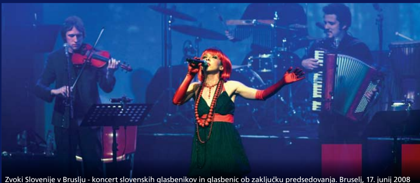
Zvoki Slovenije v Bruslju - koncert slovenskih glasbenikov in glasbenic ob zaključku predsedovanja. Bruselj, 17. junij 2008