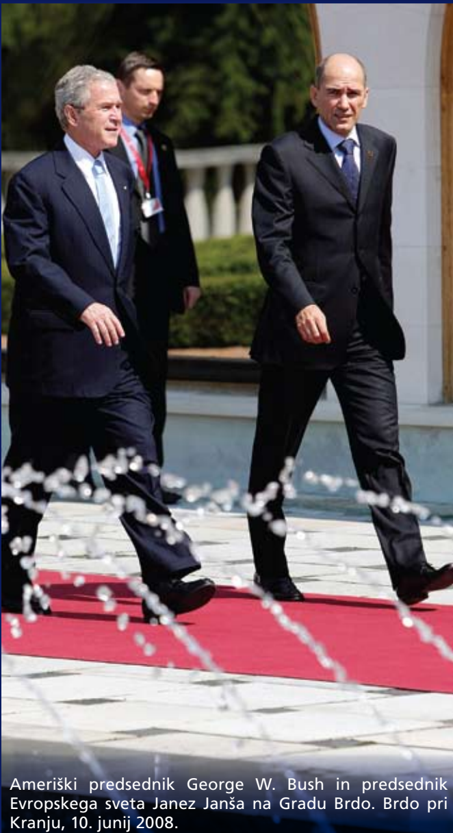
Ameriški predsednik George W. Bush in predsednik Evropskega sveta Janez Janša na Gradu Brdo. Brdo pri Kranju, 10. junij 2008.