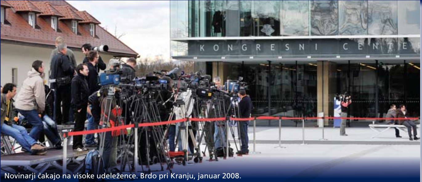
Novinarji čakajo na visoke udeležence. Brdo pri Kranju, januar 2008.