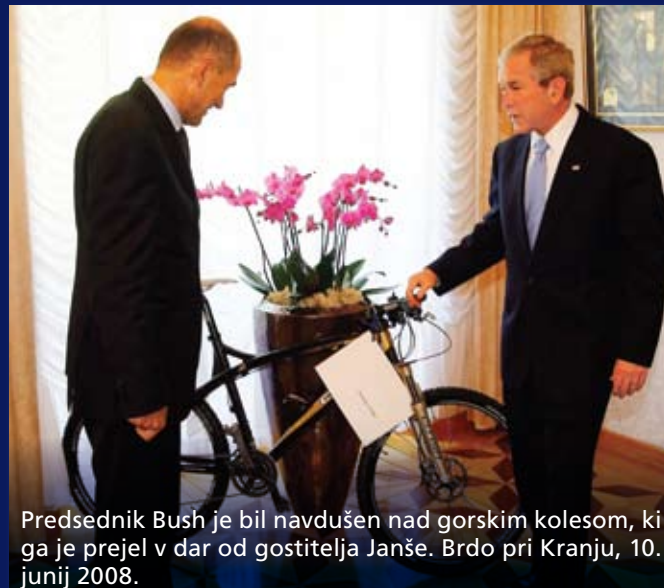
Predsednik Bush je bil navdušen nad gorskim kolesom, ki ga je prejel v dar od gostitelja Janše. Brdo pri Kranju, 10. junij 2008.