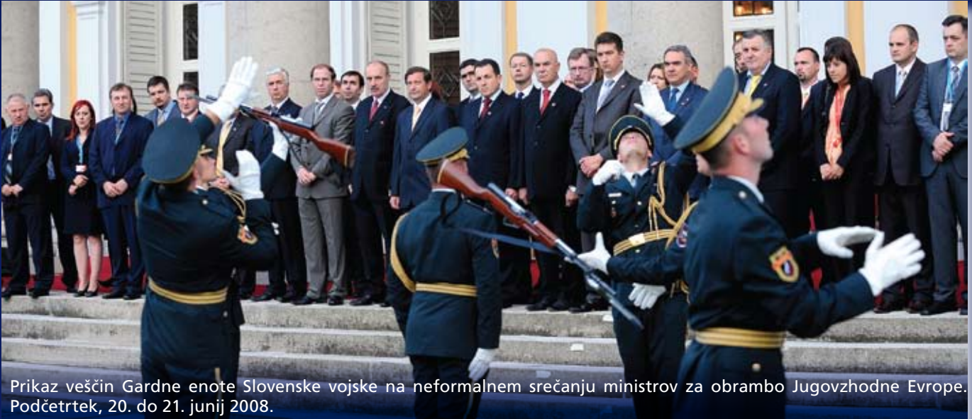
Prikaz veččin Gardne enote Slovenske vojske na neformalnem srečanju ministrov za obrambo Jugovzhodne Evrope. Podčetrtek, 20. do 21. junij 2008.