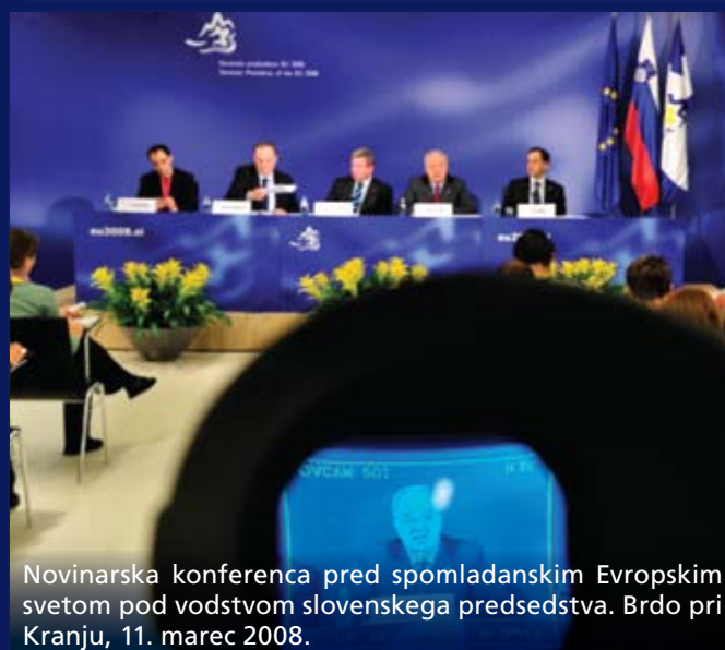
Novinarska konferenca pred spomladanskim Evropskim svetom pod vodstvom slovenskega predsedstva. Brdo pri Kranju, 11. marec 2008.