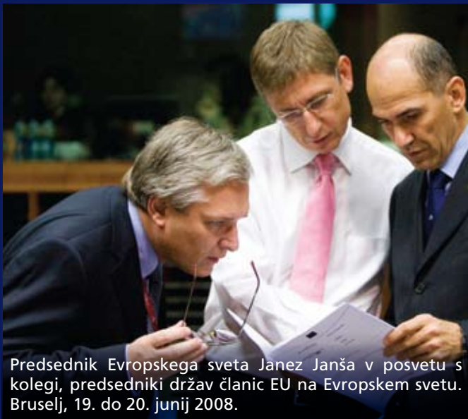
Predsednik Evropskega sveta Janez Janša v posvetu s kolegi, predsedniki držav članic EU na Evropskem svetu. Bruselj, 19. do 20. junij 2008.