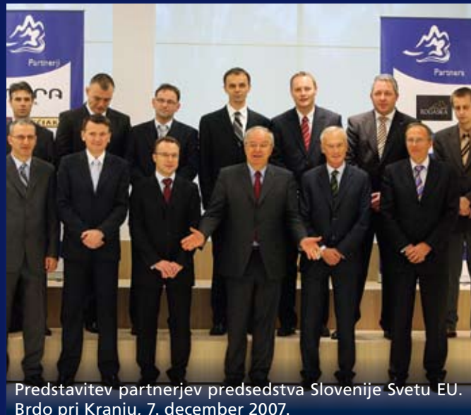
Predstavitev partnerjev predsedstva Slovenije Svetu EU. Brdo pri Kranju, 7. december 2007.