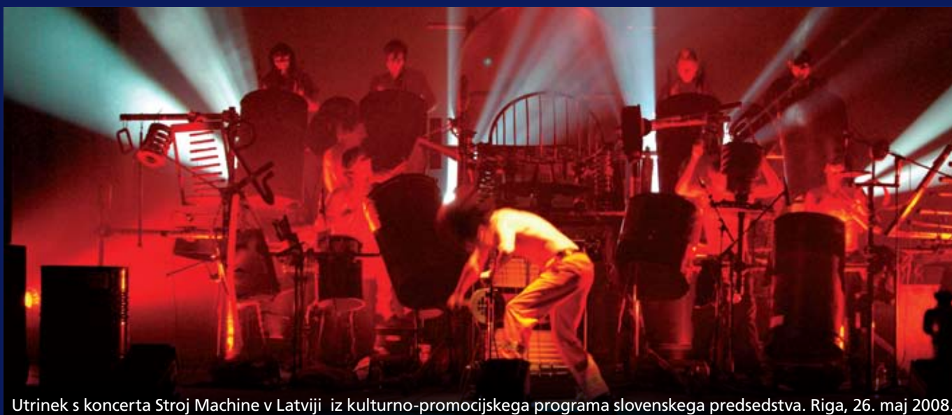
Utrinek s koncerta Stroj Machine v Latviji iz kulturno-promocijskega programa slovenskega predsedstva. Riga, 26. maj 2008.