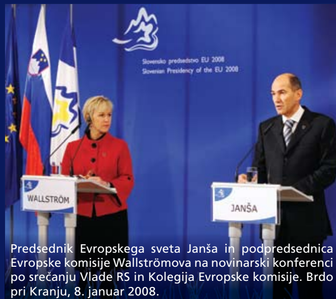
Predsednik Evropskega sveta Janša in podpredsednica Evropske komisije Wallströмова na novinarski konferenci po srečanju Vlade RS in Kolegija Evropske komisije. Brdo pri Kranju, 8. januar 2008.