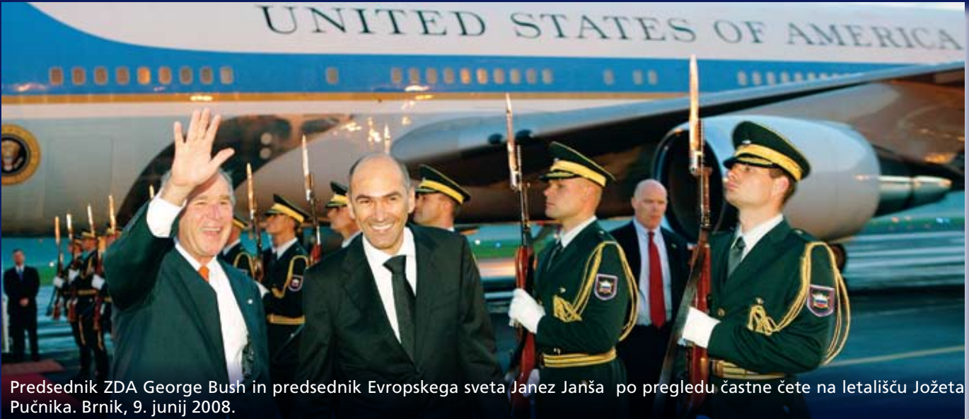
Predsednik ZDA George Bush in predsednik Evropskega sveta Janez Janša po pregledu častne čete na letališču Jožeta Pučnika. Brnik, 9. junij 2008.