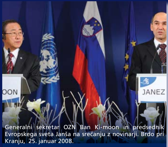
Generalni sekretar OZN Ban Ki-moon in predsednik Evropskega sveta Janša na srečanju z novinarji. Brdo pri Kranju, 25. januar 2008.