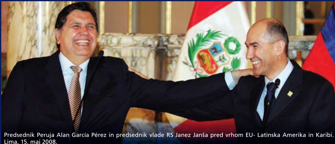
Predsednik Peruja Alan García Pérez in predsednik vlade RS Janez Janša pred vrhom EU- Latinska Amerika in Karibi. Lima, 15. maj 2008.