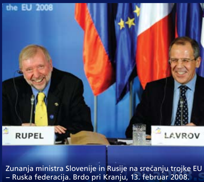
Zunanja ministra Slovenije in Rusije na srečanju trojke EU – Ruska federacija. Brdo pri Kranju, 13. februar 2008.