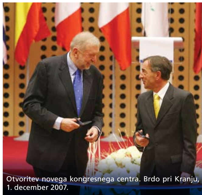
Otvoritev novega kongresnega centra. Brdo pri Kranju, 1. december 2007.

Predsedstvo se je odzvalo tudi na dogodke v Keniji in Čadu, nemire v Tibetu, potres na Kitajskem ter ciklon v Burmi/ Mjanmaru .