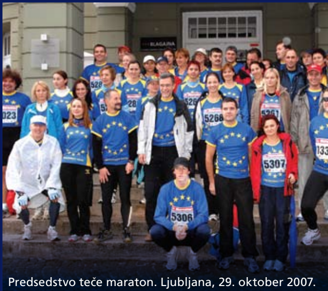
Predsedstvo teče maraton. Ljubljana, 29. oktober 2007.