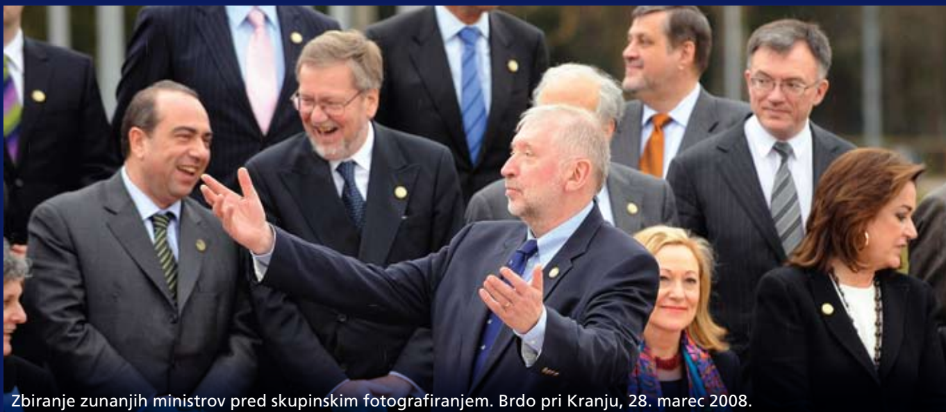
Zbiranje zunanjih ministrov pred skupinskim fotografiranjem. Brdo pri Kranju, 28. marec 2008.