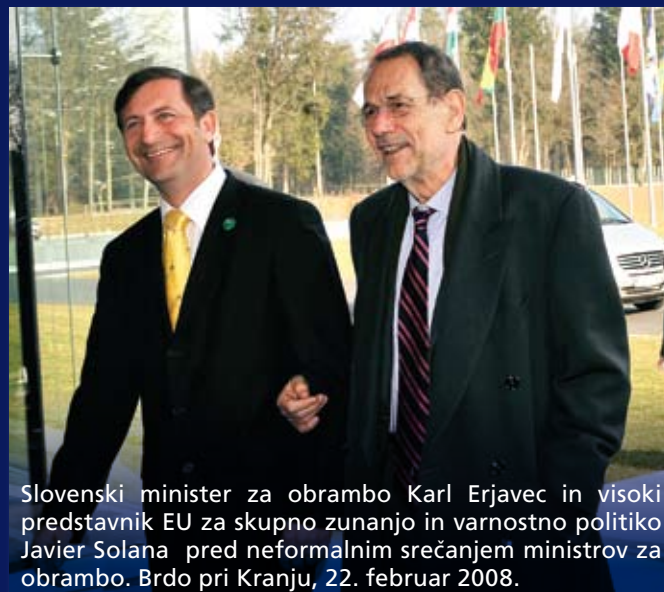
Slovenski minister za obrambo Karl Erjavec in visoki predstavnik EU za skupno zunanjo in varnostno politiko Javier Solana pred neformalnim srečanjem ministrov za obrambo. Brdo pri Kranju, 22. februar 2008.