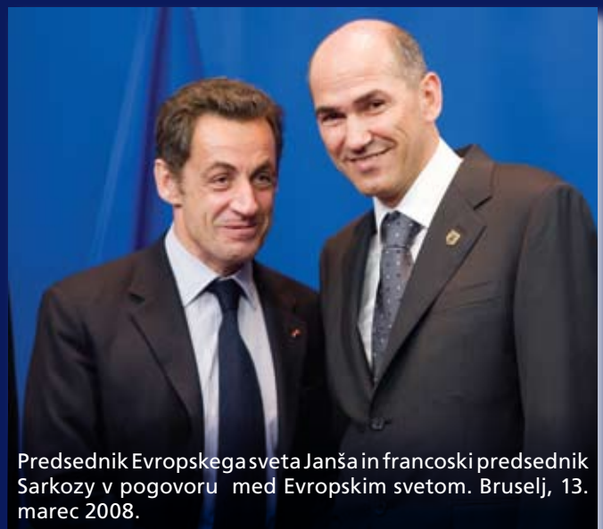
Predsednik Evropskega sveta Janša in francoski predsednik Sarkozy v pogovoru med Evropskim svetom. Bruselj, 13. marec 2008.