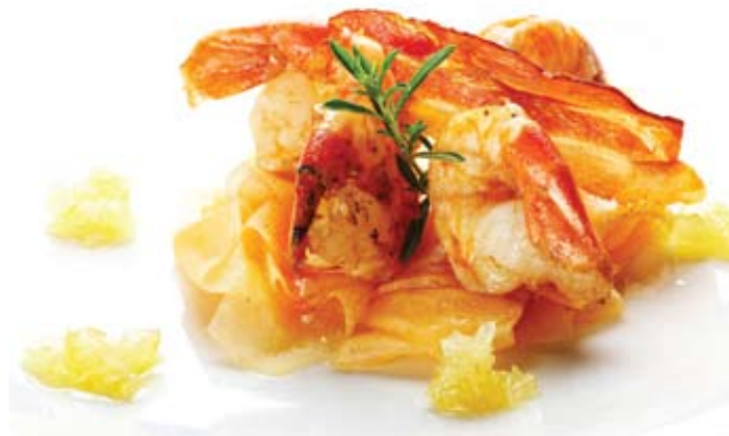
Kraljevi rakci na meloni.