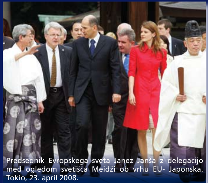
Predsednik Evropskega sveta Janez Janša z delegacijo med ogledom svetišča Meidži ob vrhu EU- Japonska. Tokio, 23. april 2008.