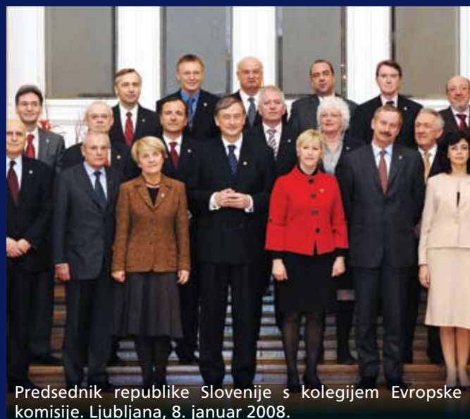
Predsednik republike Slovenije s kolegijem Evropske komisije. Ljubljana, 8. januar 2008.