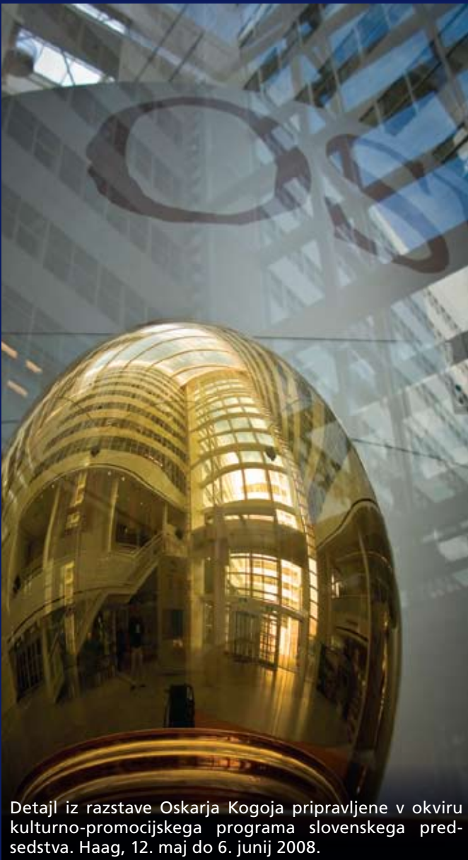
Detajl iz razstave Oskarja Kogojja pripravljene v okviru kulturno-promocijskega programa slovenskega predsedstva. Haag, 12. maj do 6. junij 2008.