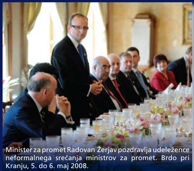
Minister za promet Radovan Žerjav pozdravlja udeležence neformalnega srečanja ministrov za promet. Brdo pri Kranju, 5. do 6. maj 2008.