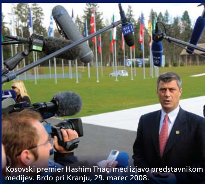
Kosovski premier Hashim Thaçi med izjavo predstavnikom medijev. Brdo pri Kranju, 29. marec 2008.