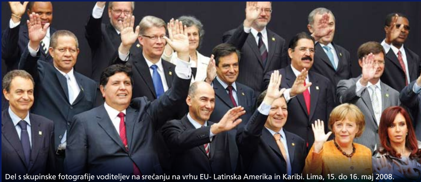
Del s skupinske fotografije voditeljev na srečanju na vrhu EU- Latinska Amerika in Karibi. Lima, 15. do 16. maj 2008.