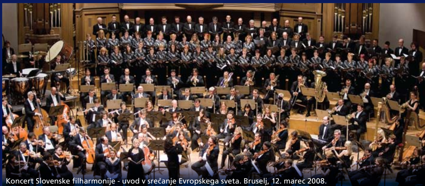
Koncert Slovenske filharmonije - uvod v srečanje Evropskega sveta. Bruselj, 12. marec 2008.