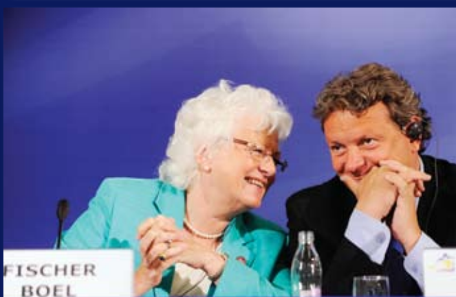
Slovenski minister za kmetijstvo, gozdarstvo in prehrano Iztok Jarc in evropska komisarka za kmetijstvo in razvoj podeželja Mariann Fischer Boel med neformalnim srečanjem ministrov za kmetijstvo. Maribor, 25. do 26. maj 2008.