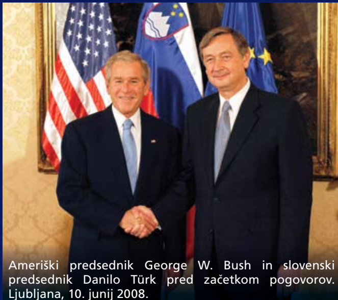
Ameriški predsednik George W. Bush in slovenski predsednik Danilo Türk pred začetkom pogovorov. Ljubljana, 10. junij 2008.