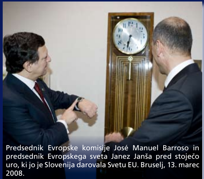
Predsednik Evropske komisije José Manuel Barroso in predsednik Evropskega sveta Janez Janša pred stoječo uro, ki jo je Slovenija darovala Svetu EU. Bruselj, 13. marec 2008.