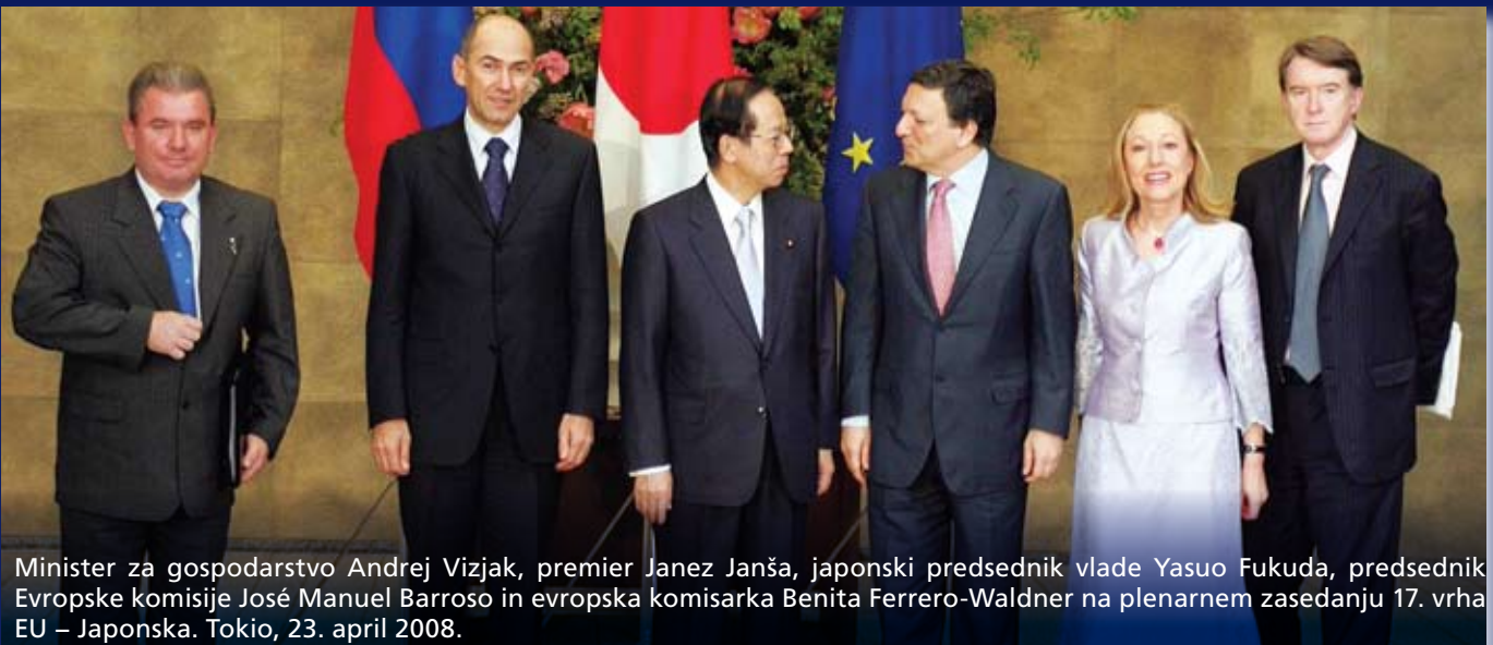
Minister za gospodarstvo Andrej Vizjak, premier Janez Janša, japonski predsednik vlade Yasuo Fukuda, predsednik Evropske komisije José Manuel Barroso in evropska komisarka Benita Ferrero-Waldner na plenarnem zasedanju 17. vrhu EU – Japonska. Tokio, 23. april 2008.