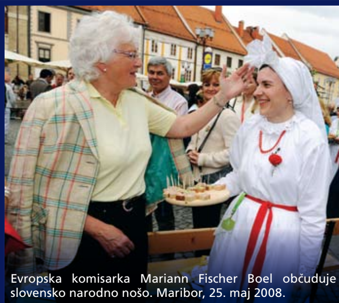
Evropska komisarka Mariann Fischer Boel občuduje slovensko narodno nošo. Maribor, 25. maj 2008.