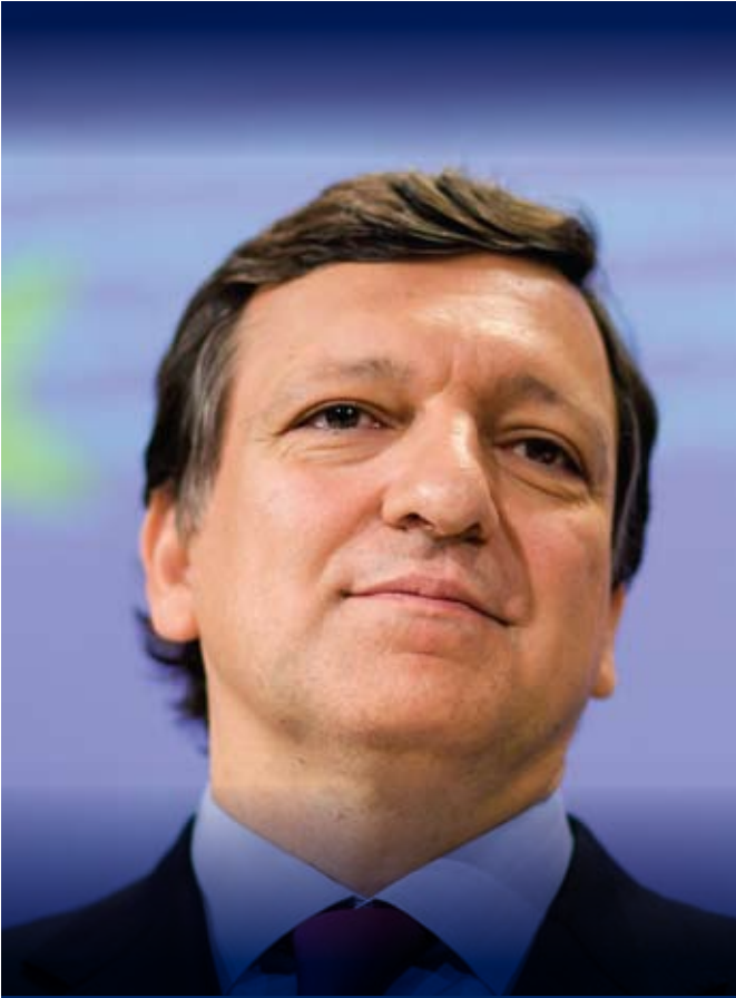
JOSÉ MANUEL BARROSO