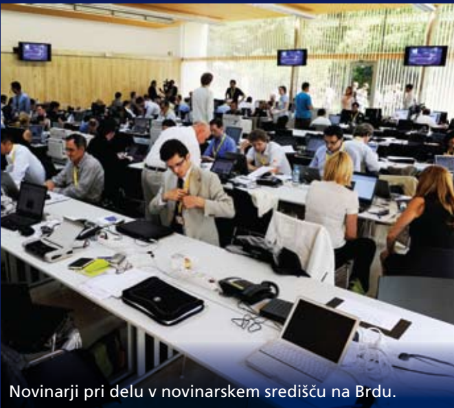
Novinarji pri delu v novinarskem središču na Brdu.