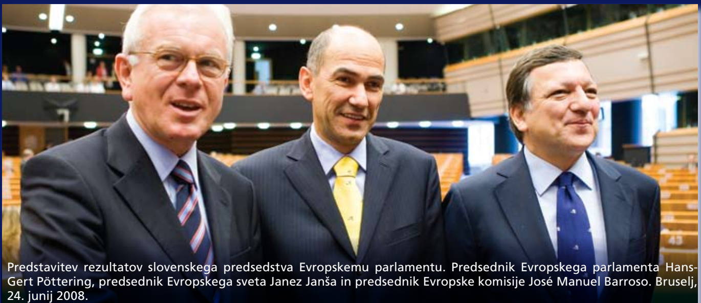
Predstavitev rezultatov slovenskega predsedstva Evropskemu parlamentu. Predsednik Evropskega parlamenta Hans-Gert Pöttering, predsednik Evropskega sveta Janez Janša in predsednik Evropske komisije José Manuel Barroso. Bruselj, 24. junij 2008.