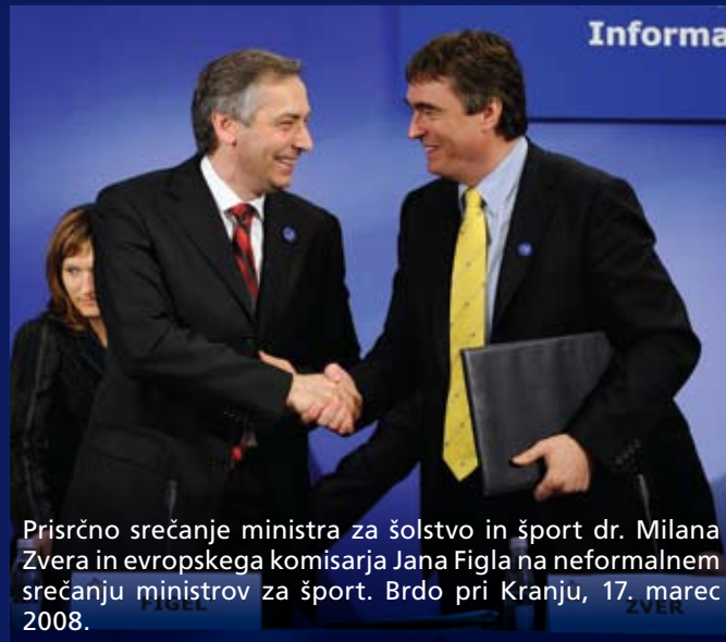
Prisrčno srečanje ministra za šolstvo in šport dr. Milana Zvera in evropskega komisarja Jana Figla na neformalnem srečanju ministrov za šport. Brdo pri Kranju, 17. marec 2008.