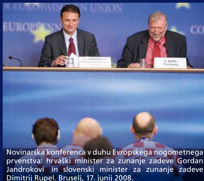
Novinarska konferenca v duhu Evropskega nogometnega prvenstva: hrvaški minister za zunanje zadeve Gordan Jandrokovi in slovenski minister za zunanje zadeve Dimitrij Rupel. Bruselj, 17. junij 2008.