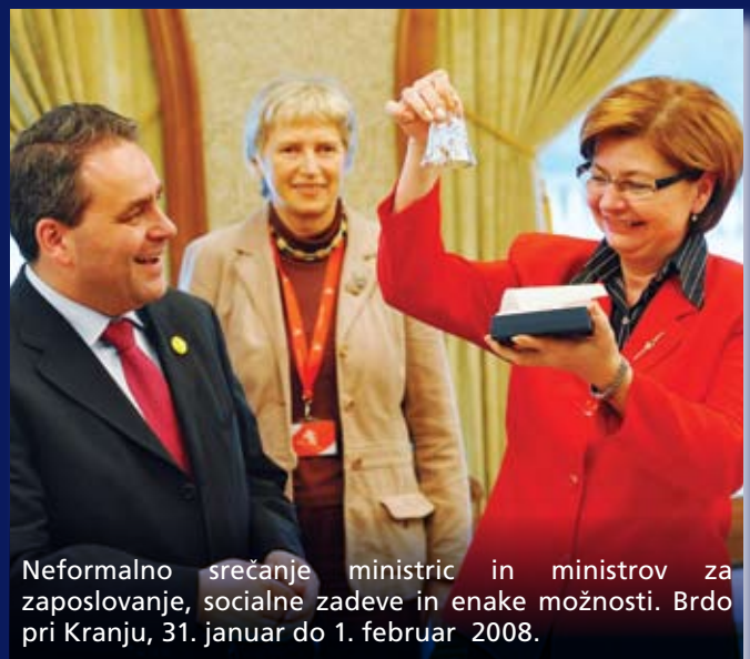
Neformalno srečanje ministrice in ministrov za zaposlovanje, socialne zadeve in enake možnosti. Brdo pri Kranju, 31. januar do 1. februar 2008.