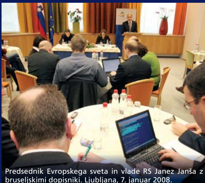
Predsednik Evropskega sveta in vlade RS Janez Janša z bruseljskimi dopisniki. Ljubljana, 7. januar 2008.