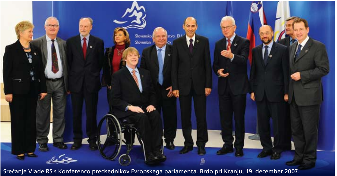
Srečanje Vlade RS s Konferenco predsednikov Evropskega parlamenta. Brdo pri Kranju, 19. december 2007.

o krepitvi civilne družbe v sosedstvu EU , ki je pod pokroviteljstvom slovenskega predsedovanja potekala 2. aprila 2008 na Brdu. Na dogodku se je zbralo 150 udeležencev iz 29 držav EU in evropske sosesčine – predvsem Zahodnega Balkana, Turčije, vzhodnih partneric Evropske sosedne politike in Rusije – ki so razpravljali o krepitvi dialoga med nacionalnimi vladami, institucijami EU in civilno družbo. Na konferenci je bila sprejeta tudi Ljubljanska deklaracija, ki vsebuje politična priporočila glede večjega vključevanja civilne družbe v načrtovanje, izvajanje in nadzor nad politikami nacionalnih vlad in institucij EU ter dolgoročne podpore razvoju in krepitvi civilne družbe v evropski sosesčini.