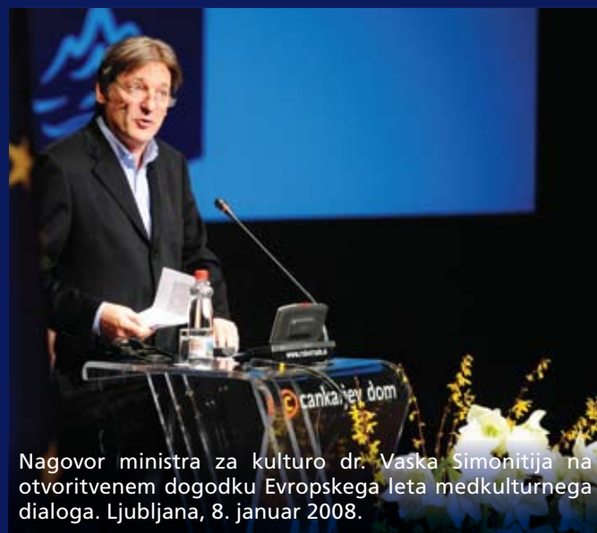
Nagovor ministra za kulturo dr. Vaska Simonitiča na otvoritvenem dogodku Evropskega leta medkulturnega dialoga. Ljubljana, 8. januar 2008.