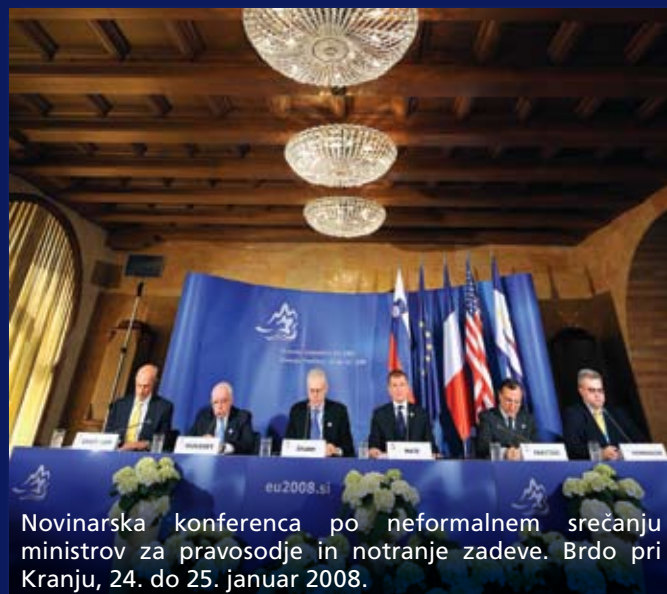
Novinarska konferenca po neformalnem srečanju ministrov za pravosodje in notranje zadeve. Brdo pri Kranju, 24. do 25. januar 2008.