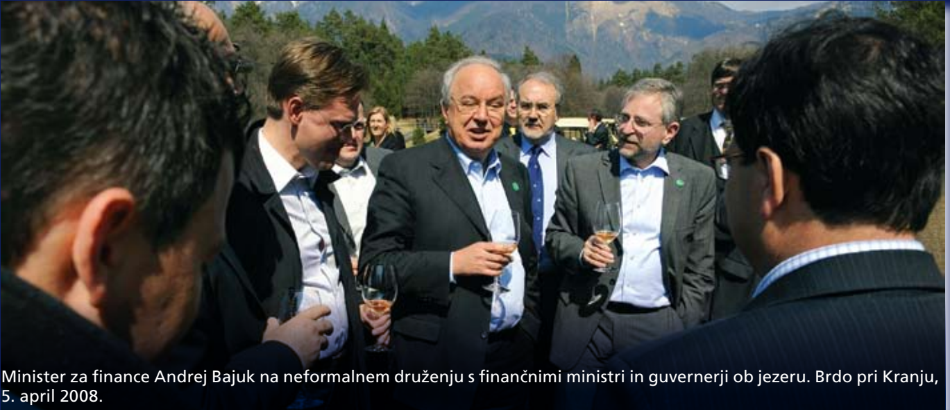
Minister za finance Andrej Bajuk na neformalnem druženju s finančnimi ministri in guvernerji ob jezeru. Brdo pri Kranju, 5. april 2008.