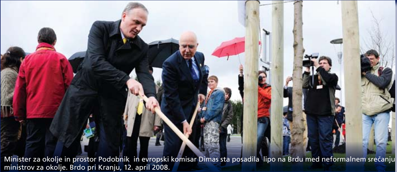
Minister za okolje in prostor Podobnik in evropski komisar Dimas sta posadila lipo na Brdu med neformalnim srečanju ministrov za okolje. Brdo pri Kranju, 12. april 2008.