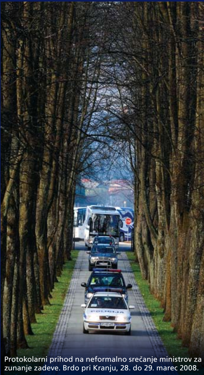
Protokolarni prihod na neformalno srečanje ministrov za zunanje zadeve. Brdo pri Kranju, 28. do 29. marec 2008.