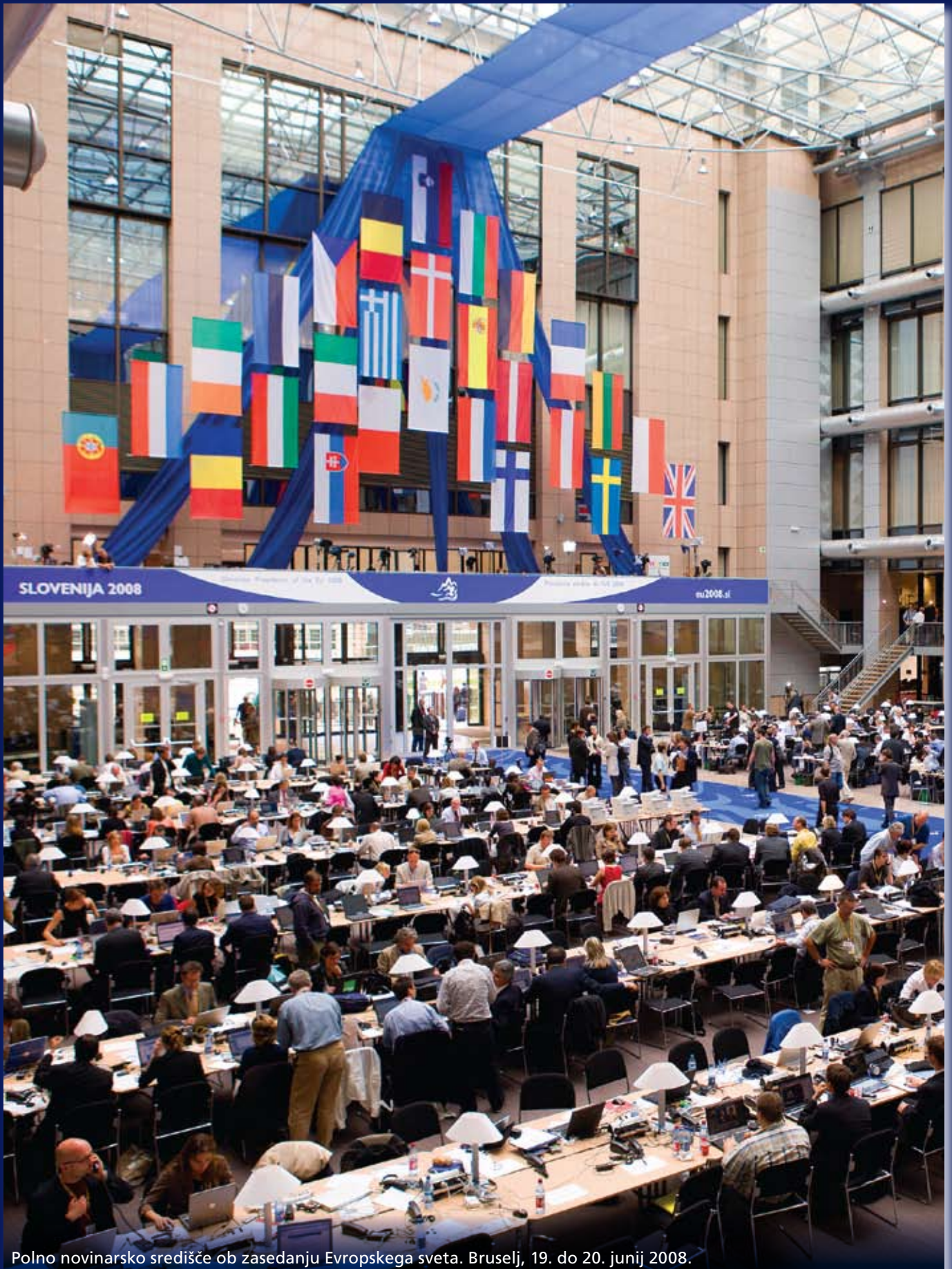
Polno novinarsko središče ob zasedanju Evropskega sveta. Bruselj, 19. do 20. junij 2008.