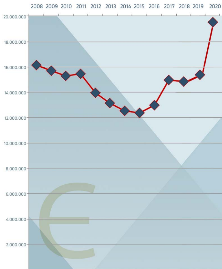
VIŠINA PRORAČUNSKIH SREDSTEV AGENCIJE OD 2008 DO 2020