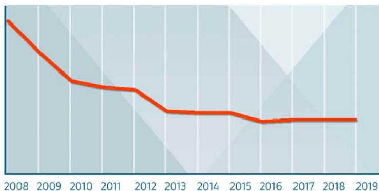
GIBANJE ŠTEVILA ZAPOSLENIH V SOVI od 2008 do 2019

V agenciji je bilo na dan 31.12.2019 zaposlenih 59% moških in 41% žensk. Skupno število zaposlenih je v primerjavi s stanjem na dan 31.12.2018 ostalo nespremenjeno. Povprečna starost zaposlenih na dan 31.12.2019 je znašala 46,6 leta.