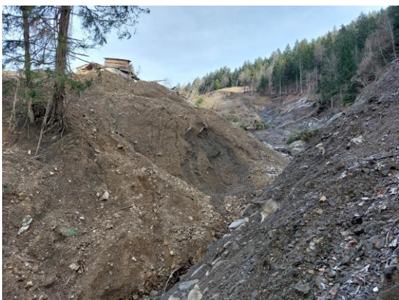
Fotografija 3: Osrednji del zemeljskega plazu – grapa po kateri se pretaka voda (8.12.2023)