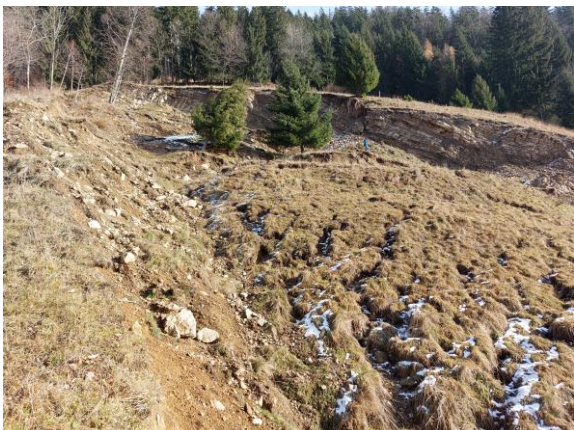
Fotografija 1: Zgornji odlomni rob plazu (8.12.2023)