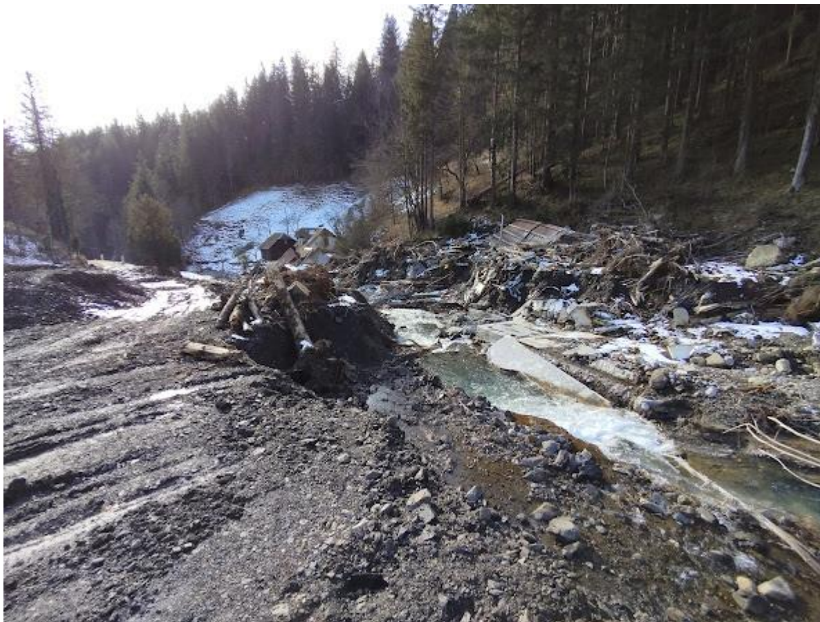
Fotografija 1: pogled na stanovanjski objekt iz Z smeri