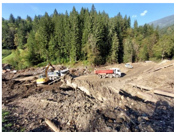
Fotografija 6: Spodnji del plazu – pogled na objekta Strmec 28 in Strmec 29 (11.10.2023)