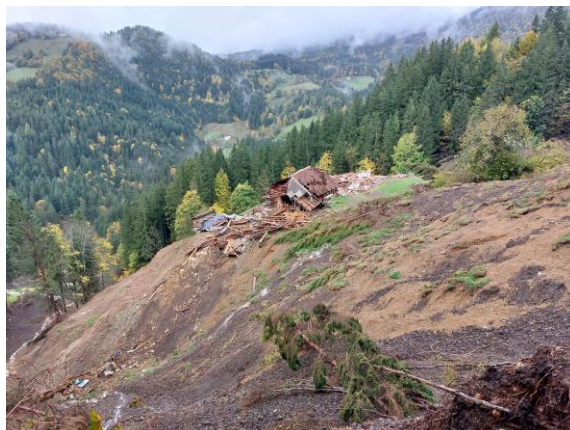
Fotografija 2: Pogled na lokacijo objekta Konjski vrh 31 (8.12.2023)