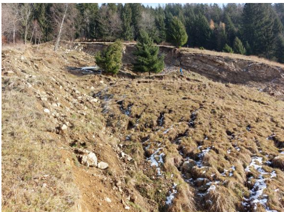
Fotografija 1: Zgornji odlomni rob plazazu (8.12.2023)