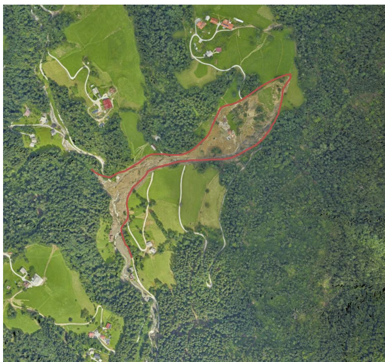
Slika 1: Pogled (DOF) na lokacijo splazitve – po Ujmi 2023.

Lokacije objektov Konjski vrh 31, Konjski vrh 41, Strmec 28 in Strmec 29 je v neurju 4.8.2023 prizadel plaz Jelen, ki se je sprožil v dolini potoka Dupljenik, SV od Luč.