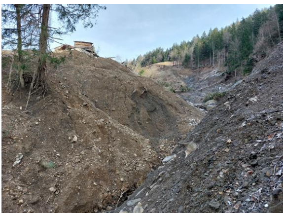
Fotografija 3: Osrednji del zemeljskega plazazu – grapa po kateri se pretaka voda (8.12.2023)