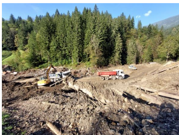
Fotografija 6: Spodnji del plazazu – pogled na objekta Strmec 28 in Strmec 29 (11.10.2023)