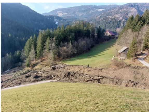
Fotografija 5: Pogled na lokacijo objekta Konjski vrh 41 (8.12.2023)