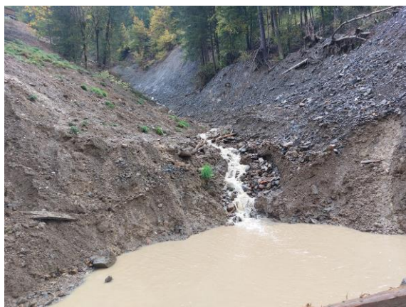
Fotografija 4: Povečan dotok vode ob večjem deževju (11.10.2023)