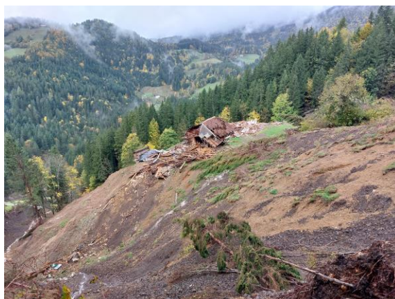
Fotografija 2: Pogled na lokacijo objekta Konjski vrh 31 (8.12.2023)