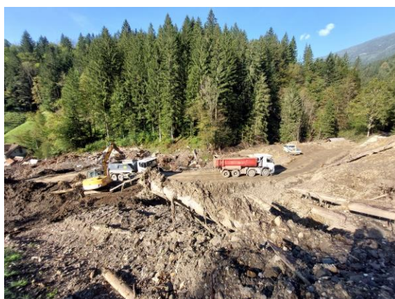
Fotografija 6: Spodnji del plazju – pogled na objekta Strmec 28 in Strmec 29 (11.10.2023)