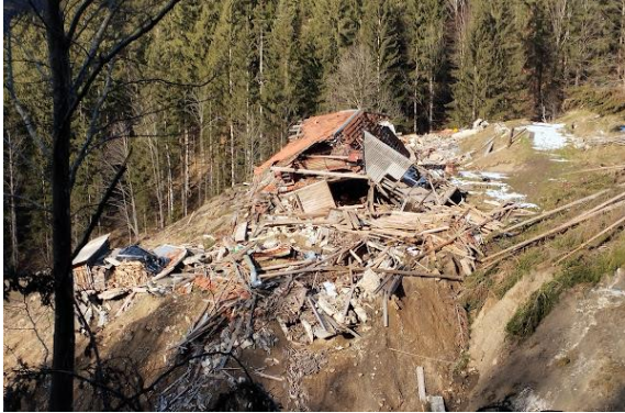
Fotografija 1: Pogled na stanovanjski objekt iz Z smeri