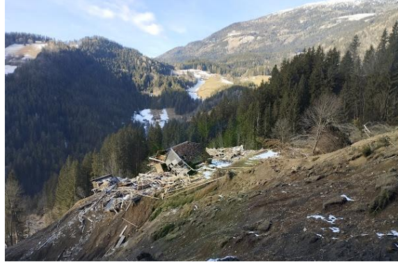
Fotografija 2: Pogled na lokacijo iz smeri V