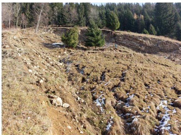
Fotografija 1: Zgornji odlomni rob plazju (8.12.2023)