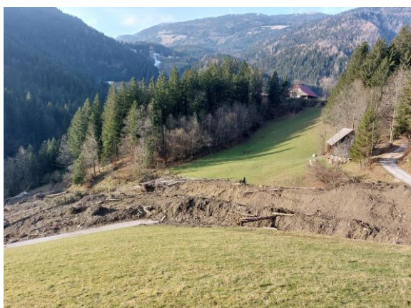
Fotografija 5: Pogled na lokacijo objekta Konjski vrh 41 (8.12.2023)