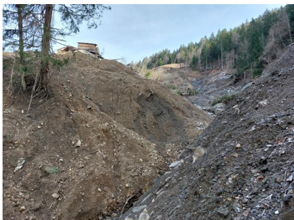
Fotografija 3: Osrednji del zemeljskega plazju – grapa po kateri se pretaka voda (8.12.2023)