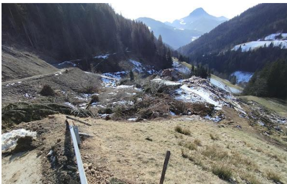
Fotografija 3: Pogled na lokacijo iz smeri S