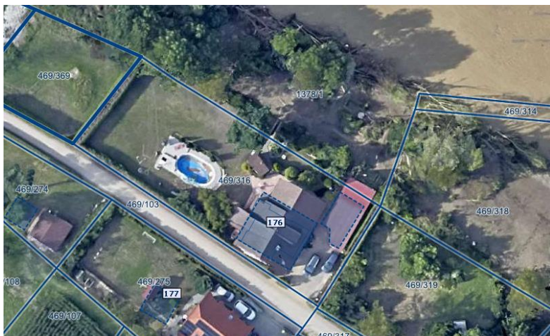
Fotografija 1: Ortofoto takoj po poplavih avgusta