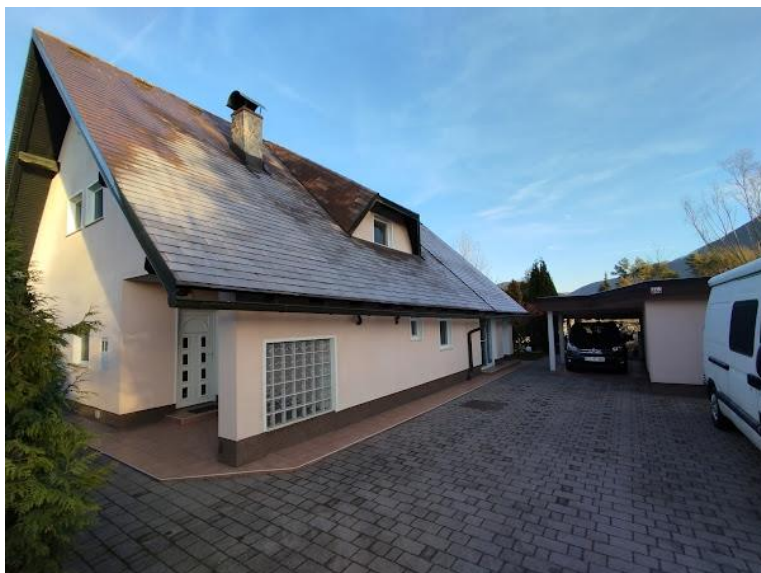
Fotografija 2: Pogled iz smeri J