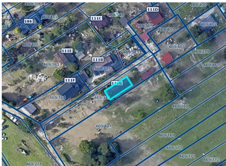
Slika 1 Ortofoto takoj po poplavih avgusta