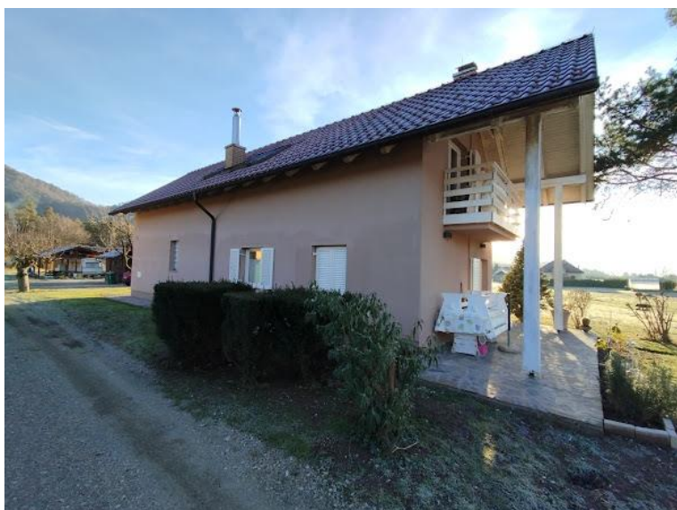
Slika 2 Pogled iz Z