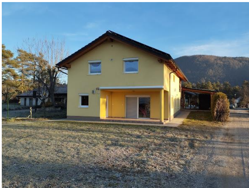
Slika 2 Pogled iz JZ