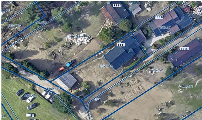
Slika 1 Ortofoto takoj po poplavih avgusta