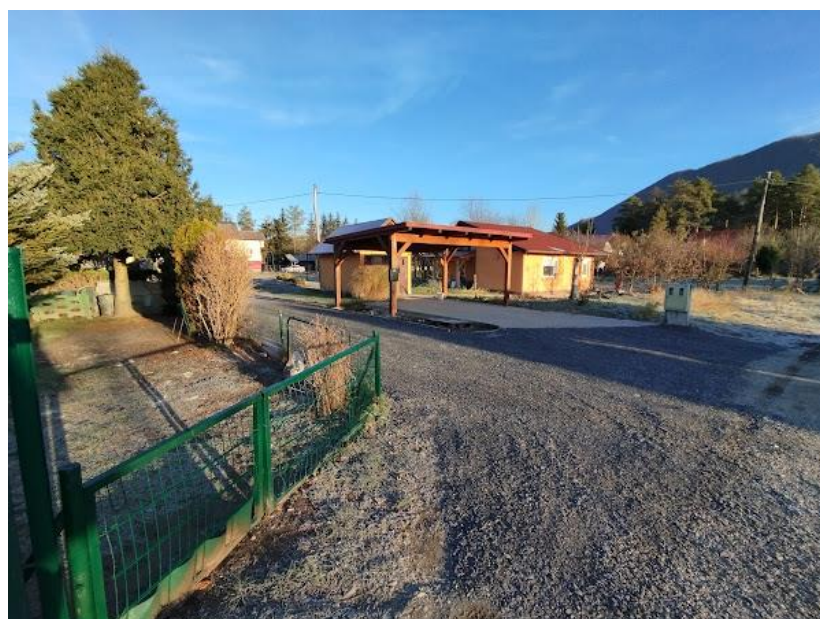
Slika 2 Pogled iz J