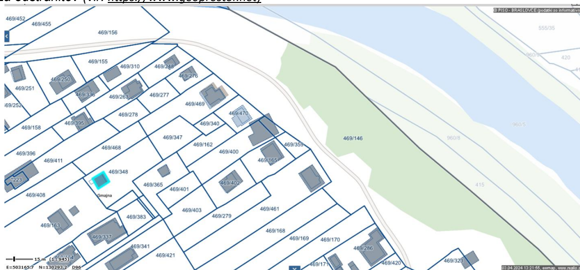
Slika 1: SITUACIJA IN NAVEDBA OBJEKTOV , ki so skladno s STROKOVNIM MNENJEM predlagani za odstranitev

Zaradi teh dejstev predlagamo odstranitev objektov.