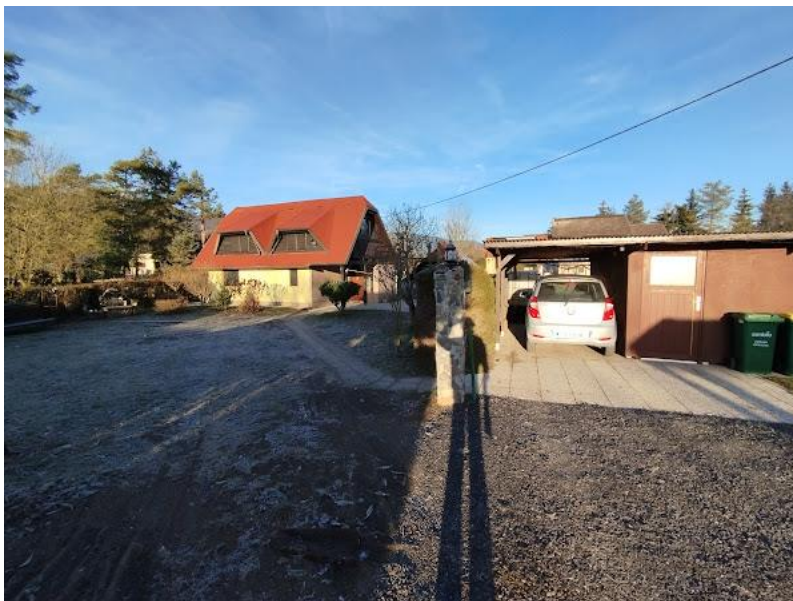
Slika 2 Pogled iz JV