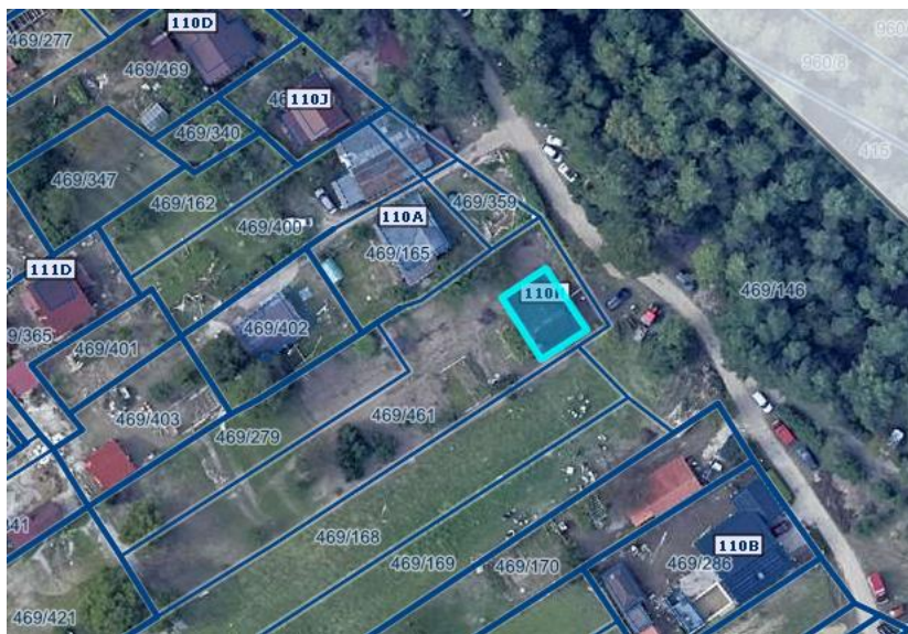
Slika 1 Ortofoto takoj po poplavih avgusta