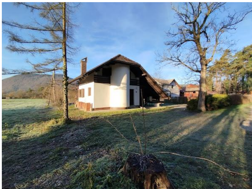
Slika 2 Pogled iz smeri V