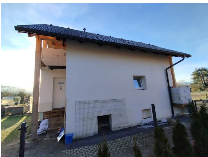
Slika 3 Pogled iz smeri S