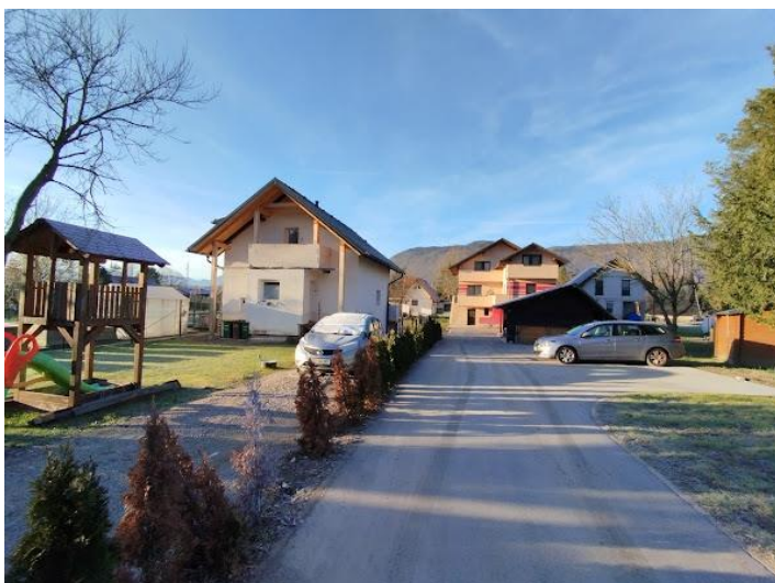
Slika 2 Pogled iz smeri SV