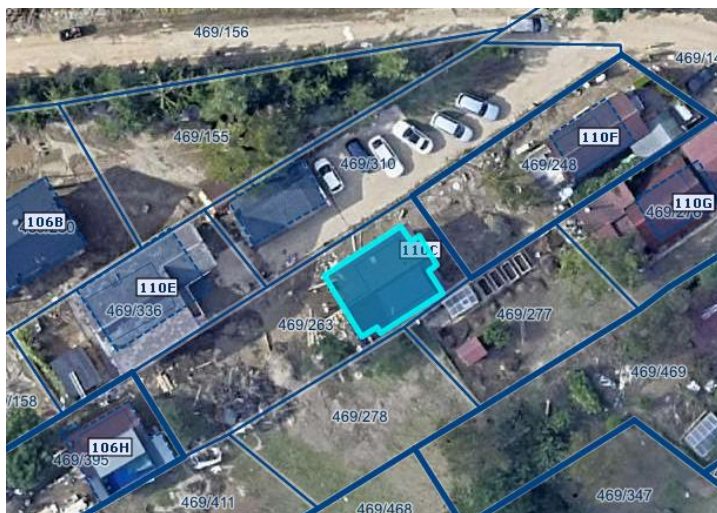
Slika 1 Ortofoto takoj po poplavih avgusta