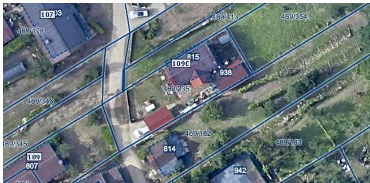
Slika 1 Ortofoto takoj po poplavah avgusta