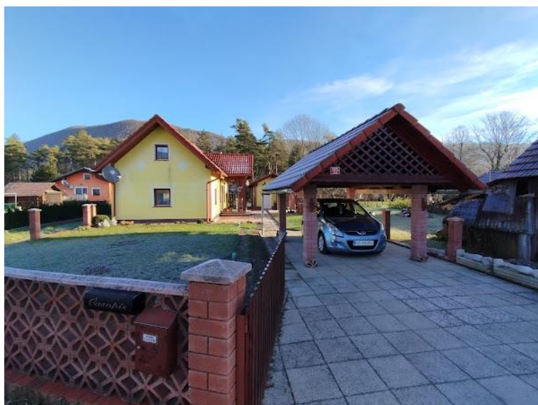
Slika 2 Pogled iz smeri JZ.. stavba 815