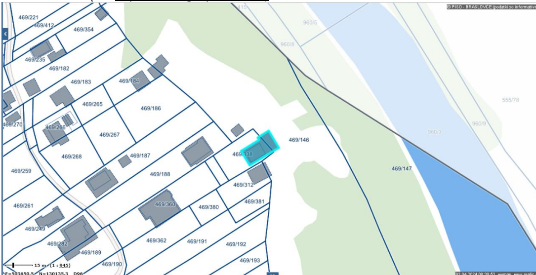
Slika 1: SITUACIJA IN NAVEDBA OBJEKTOV , ki so skladno s STROKOVNIM MNENJEM predlagani za odstranitev (vir: https://www.geoprostor.net )

Zaradi teh dejstev predlagamo odstranitev objektov.