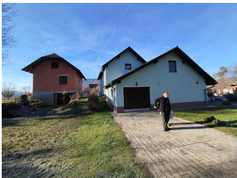
Slika 2 Pogled iz smeri V