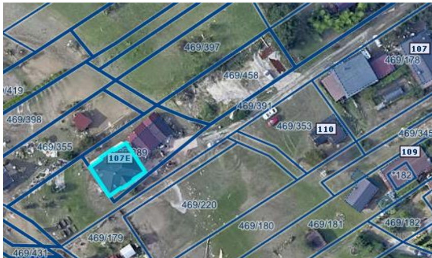
Slika 1 Ortofoto takoj po poplavih avgusta