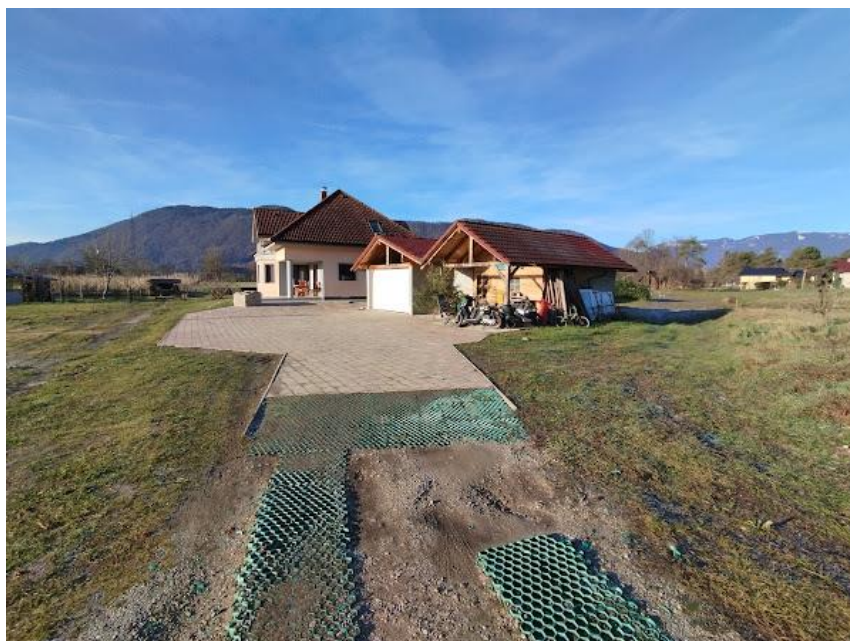
Slika 2 Pogled iz smeri SV