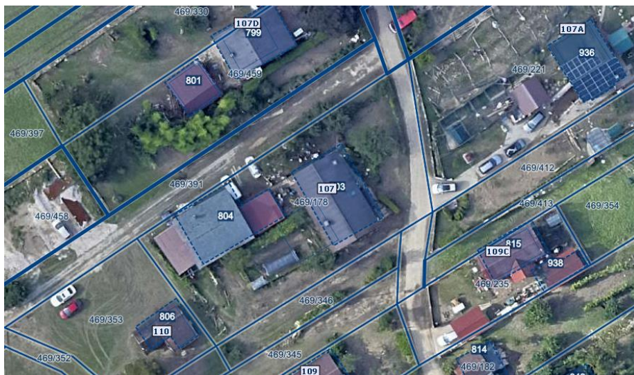
Slika 1 Ortofotografija takoj po poplavi avgusta