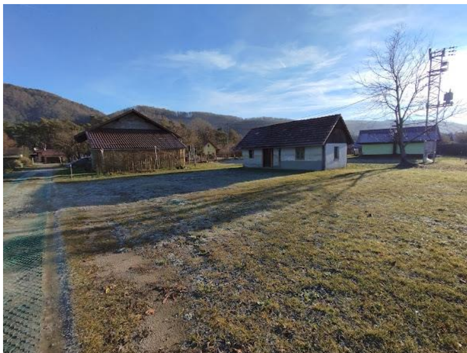
Slika 22 Pogled iz smeri JZ