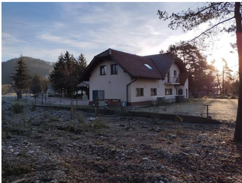
Slika 2 Pogled iz smeri Z