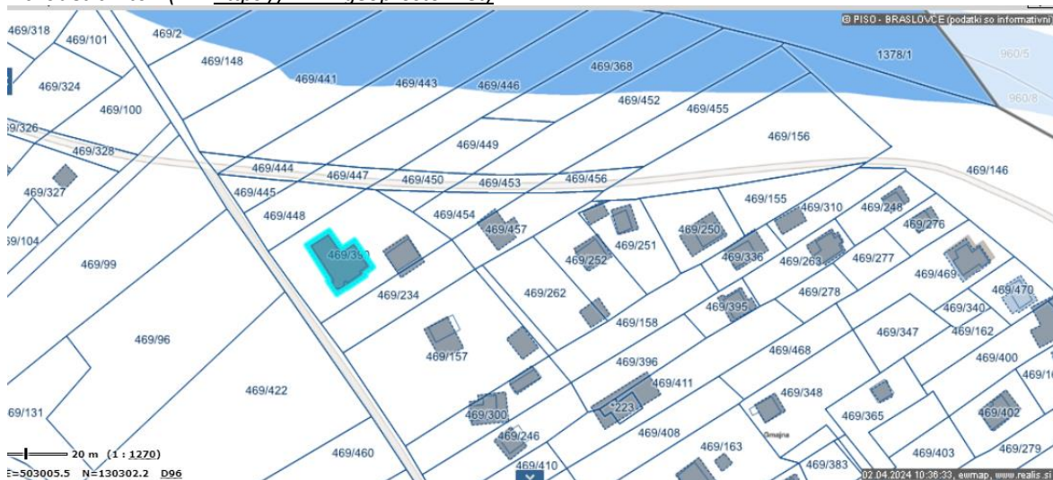
Slika 1: SITUACIJA IN NAVEDBA OBJEKTOV , ki so skladno s STROKOVNIM MNENJEM predlagani za odstranitev

Zaradi teh dejstev predlagamo odstranitev objektov.