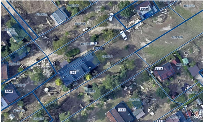
Slika 1: Ortofoto po poplavih avgusta