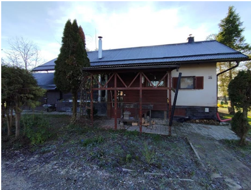
Slika 2: Pogled iz smeri SZ na objekt