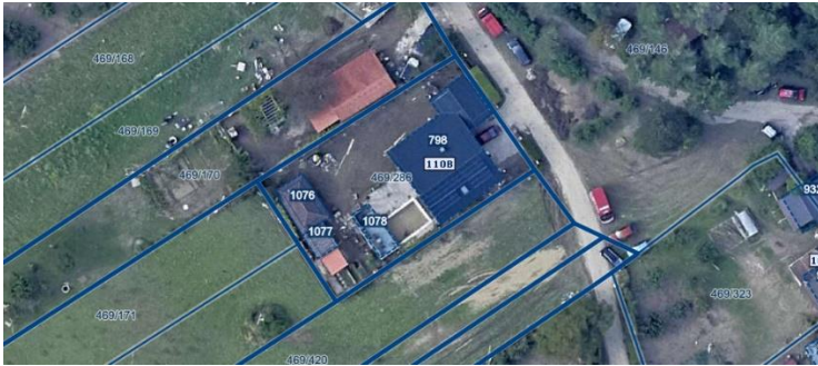
Slika 1 Ortofoto takoj po poplavah avgusta