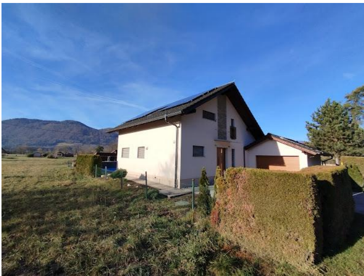
Slika 2 Pogled iz smeri V.. stavba 798