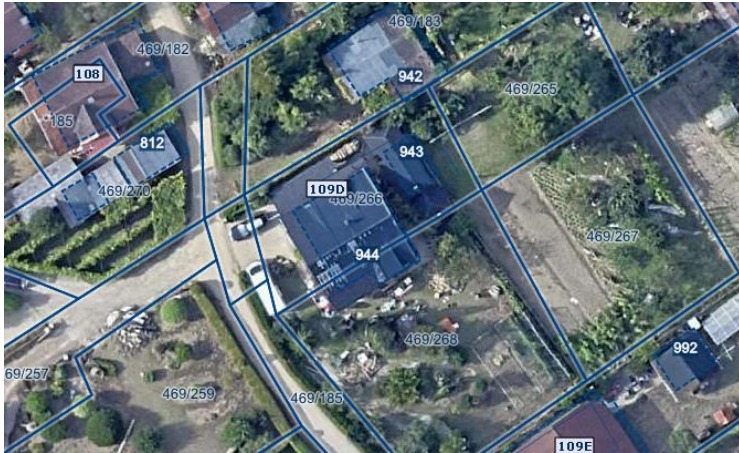
Slika 1 Ortofoto takoj po poplavah avgusta