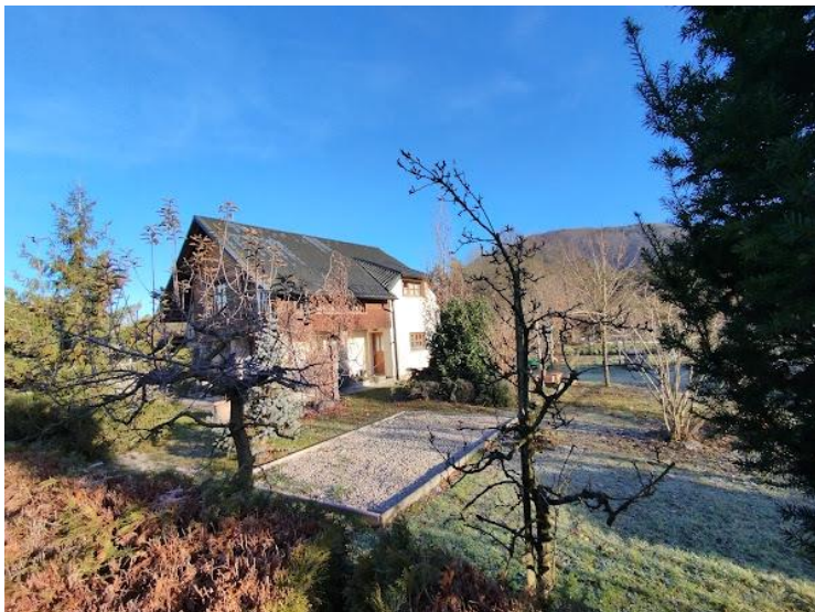
Slika 2 Pogled iz smeri J