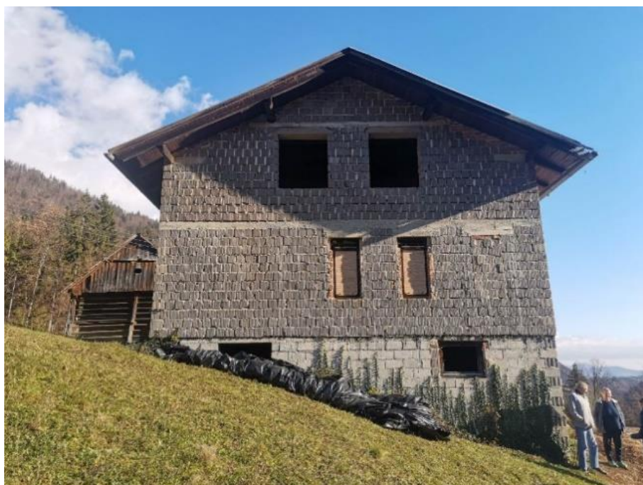
Fotografija 1: Pogled na Z fasado stanovanjskega objekta.