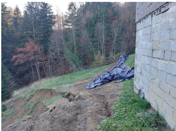
Fotografija 1: Pogled na odlomni rob pod objektom Poljane 26, razpoke vidne tudi na travniku desno od objekta (22.11.2023)