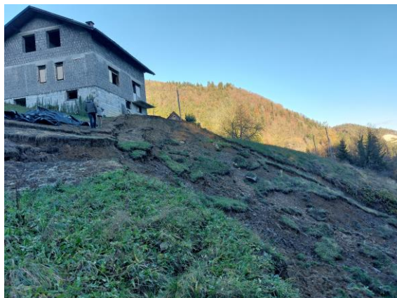
Fotografija 2: Pogled na plaz pod objektom (22.11.2023)