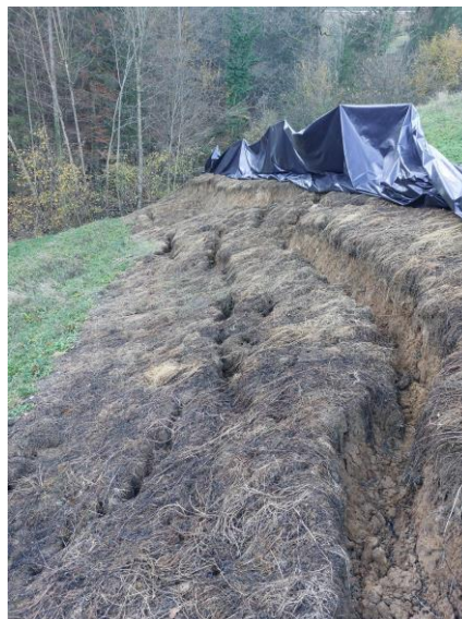
Fotografija 4: Sekundarni odlomni robovi na travnati površini desno od objekta Poljane 26 (22.11.2023)