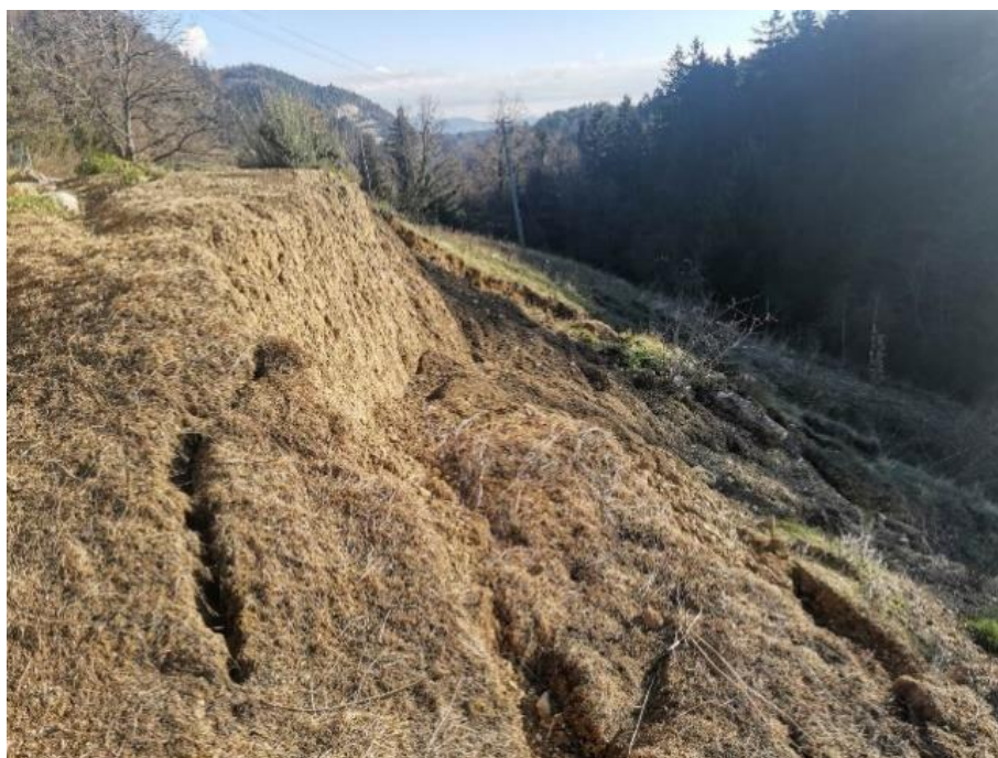
Fotografija 2: Plaz na južni strani ob objektu.