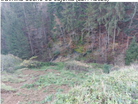
Fotografija 3: Pogled na naguban plazovit teren nad vodotokom Lučnik (22.11.2023)