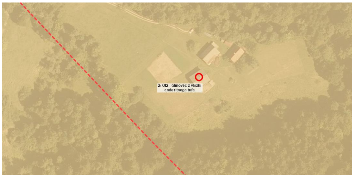
Slika 2: Osnovna geološka karta z označenim območjem objekta Poljane 26, rdeča črtna črta prikazuje prelom smeri SZ-JV. Po coni šibkih kamnin, je voda ustvarila stalen vodotok Lučnik 26

Objekt leži na območju glinavcev z vložki andezitnega tufa ( Ol_2 ), kateri zaradi slabših mehanskih karakteristik (prelomna cona) in dotoka precejne vode preperevajo v globino več 10 m. Globina do trdne podlage je spremenljiva in nepredvidljiva. Povečana količina precejne vode s hriba ter naraščanje vodotoka Lučnik, ki je spodkopal brežino, je po Ujmi v avgustu 2024 sprožila nov odlomni rob in nastanek plazju. Ocenjena površina starejšega in ponovno aktiviranega plazju znaša cca 4.000 m 2 .