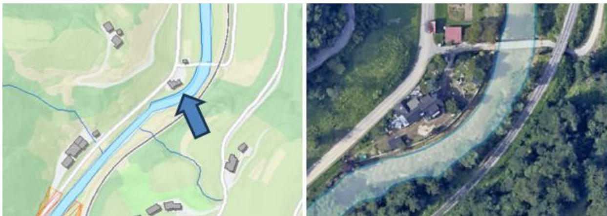
Slika 1: Atlas voda – Skorno pri Šoštanju 20

Objekt Skorno pri Šoštanju 20 se nahaja v soteski Penk na desnem bregu reke Pake. Do sedaj so bili poplavljeni leta 1990, 2012 in 2023. Gre za stanovanjski objekt s pomožnimi objekti na parcelah št. 215/2 in 215/4 k.o. Skorno pri Šoštanju. Območje je na severni strani omejeno z lokalno cesto za Lokovico, na zahodni strani s cesto Šoštanj – Šmartno ob Paki, na vzhodu pa se nahaja visokovodni zid ob reki Paki. Poplavne karte za ta odsek reke Pake še niso izdelane.