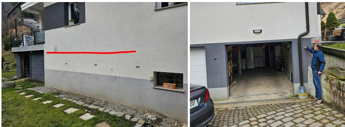
Slika 2: Doseg poplavne vode avgusta 2023

Ob poplavi 4.8.2023 so bili objekti poplavljeni. Visokovodni zid ob reki Paki, ki je bil zgrajen leta 2010, je bil preplavljen za ca 1m. V stanovanjskem objektu je visoka voda segala do višine ca 1.8 - 2.0m, kar bi ga glede na veljavno zakonodajo umeščalo v razred velike poplavne nevarnosti. Veliko težavo ob vseh poplavnih dogodkih predstavlja tudi visoka podtalnica, saj stanovanjski objekt ni odporen na tovrstne dogodke. Visoka podtalnica zalije pritlično etažo stanovanjskega objekta, kjer se nahajajo garaža, kurilnica, skladišče, letna kuhinja, shrambe in delavnica, do višine ca 1m.