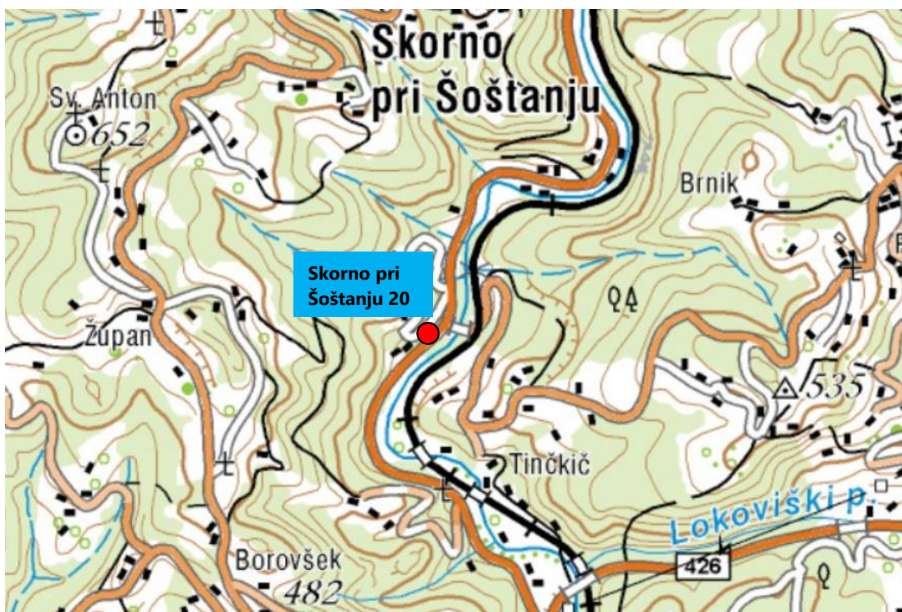
Slika 3: prikaz lokacije obravnavanih objektov