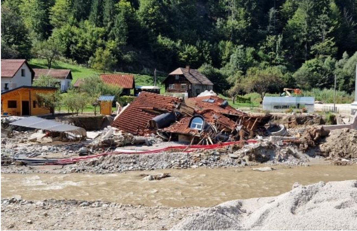
Fotografija 1: Pogled na porušeno hišo po poplavih