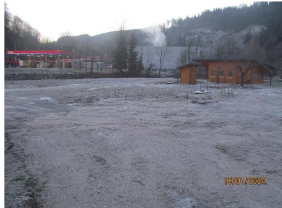
Fotografija 3: Pogled na parcelo kjer je nekoč stal objekt