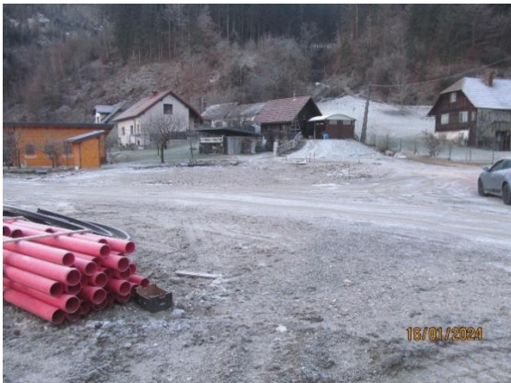
Fotografija 2: Pogled na parcelo kjer je nekoč stal objekt