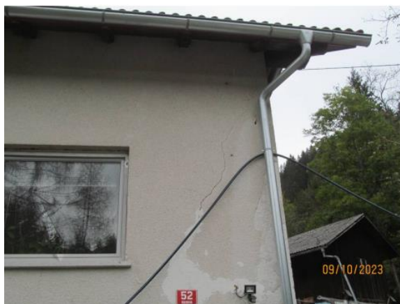
Fotografija 2: Razpoke na JZ fasadi objekta