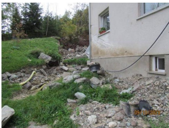
Fotografija 3: nanos materiala na JZ strani objekta