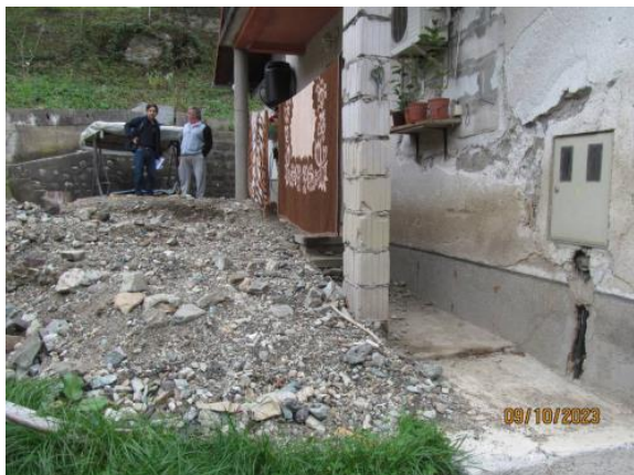
Fotografija 1: nanos materiala na Z strani objekta