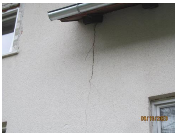
Fotografija 4: Razpoke na SV fasadi objekta