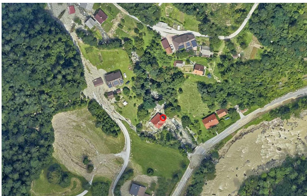
Slika 1: Pogled (DOF) na območje stanovanjskega objekta Raduha 52, po ujmi avgusta 2023

Prvi terenski ogled je bil opravljen 5.10.2023, kjer je potekalo podrobno inženirsko-geološko kartiranje širše okolice. Ugotovljeno je bilo, da je po močnem deževju med 4. in 5. avgustom 2023 nastalo več novih odlomnih robov na starejšem (fosilnem) kamninskem plazu, kar se kaže v razpokanosti in posedenosti okoliškega terena ter razpokanosti lokalne ceste v zaledju plazu. Prav tako je obravnavani objekt avgusta 2023 zasul hudourniški drobirski tok, ki je pritekel iz S dela pobočja.