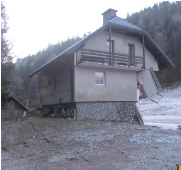
Fotografija 3: Pogled na poškodovani objekt (zahod)