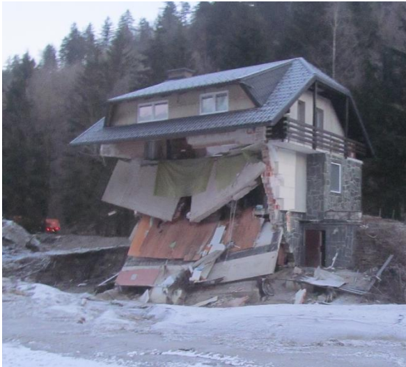
Fotografija 1: Pogled na poškodovani objekt (jug)