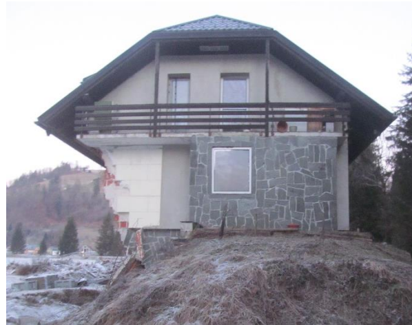
Fotografija 2: Pogled na poškodovani objekt (vzhod)