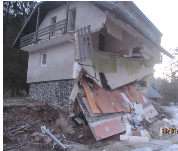
Fotografija 4: Pogled na poškodovani objekt (jug)