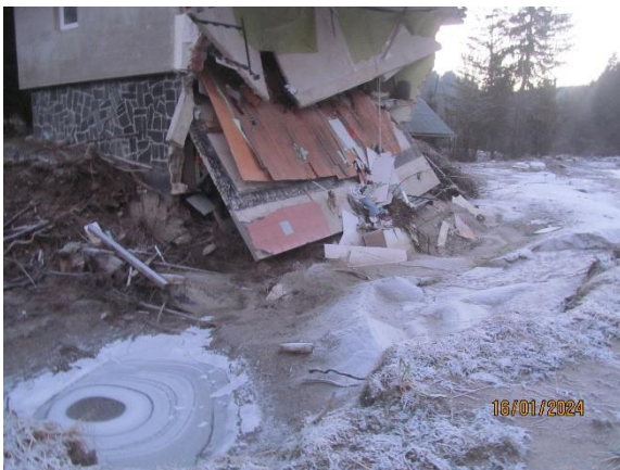
Fotografija 5: Pogled na delno porušen objekt in spodjedena temeljna tla