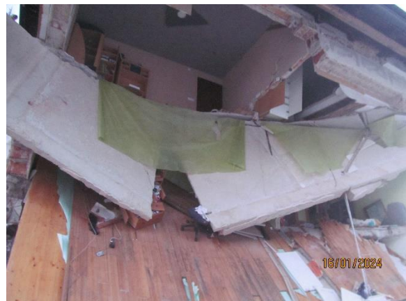
Fotografija 6: Porušeni medetažni konstrukciji