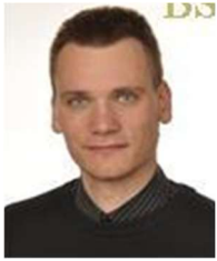
Borut Poljšak, Banka Slovenije

Mnenja in zaključki, objavljeni v prispevku v tej publikaciji, ne odražajo nujno uradnih stališč Banke Slovenije ali njenih organov.