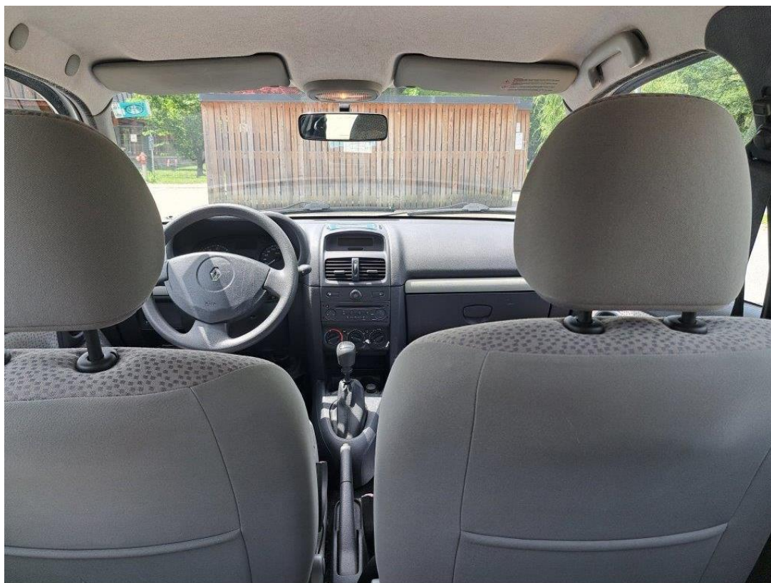
Vozilo številka 2