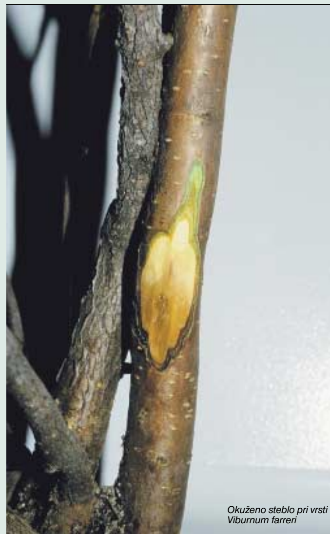
Okuženo steblo pri vrsti Viburnum farreri

Pokličite: 041/ 354 405 (FURS) ali 01/ 28 05 210 (KIS) Informacije: http://www.furs.si , e-mail: furs.mkgp@gov.si