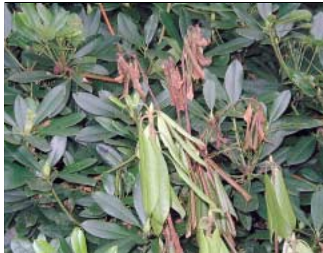
Vejice rododendrona se sušijo.

Od leta 1993 so na okrasnih slečih ( Rhododendron spp.) v Nemčiji in na Nizozemskem opažali novo bolezen, ki je povzročala odmiranje vejic. Približno v istem času se je v ZDA pojavilo propadanje ameriških vrst hrastov, znano pod imenom "sudden oak death". Posušilo se je na desetstisoče dreves. V obeh primerih gre za istega povzročitelja- novo vrsto glivi podobnih organizmov iz skupine Oomycetes , ki so jo imenovali Phytophthora ramorum . V Evropi je sprva povzročala le propadanje rododendronov in brogovit ( Viburnum spp.) v drevesnicah, pozneje pa so jo ugotovili tudi v parkih in, kar je še posebej zaskrbljujoče, tudi na posameznih primerkih pomembnih drevesnih vrst, kot so hrast, bukev in pravi kostanj. Slovensko ime bolezn, fitoftorna sušica vejic, se nanaša na najbolj značilna bolezenska znamenja na rododendronu, sicer pa so bolezenska znamenja na številnih vrstah gostiteljskih rastlin zelo raznolika.