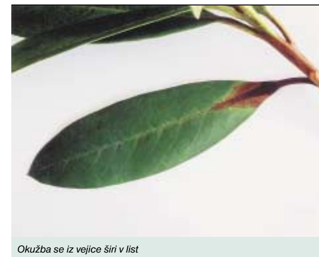
Okužba se iz vejice širi v list