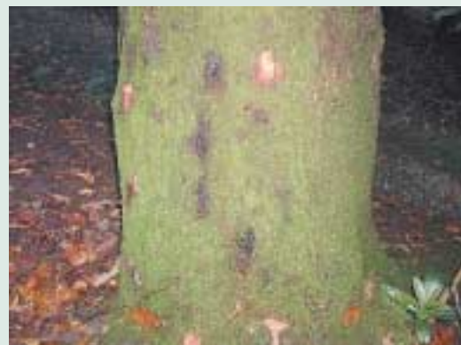
Okužba hrasta Quercus falcata

Z odločbo Komisije Evropske skupnosti (2002/757/EC) in njenimi dopolnili so predpisani fitosanitarni ukrepi za preprečevanje vnosa in širjenja P. ramorum znotraj Skupnosti. V Sloveniji ravnanje glede tega organizma ureja Pravilnik o fitosanitarnih ukrepih za preprečevanje vnosa in širjenja glive Phytophthora ramorum (Uradni list RS, 120/2004).