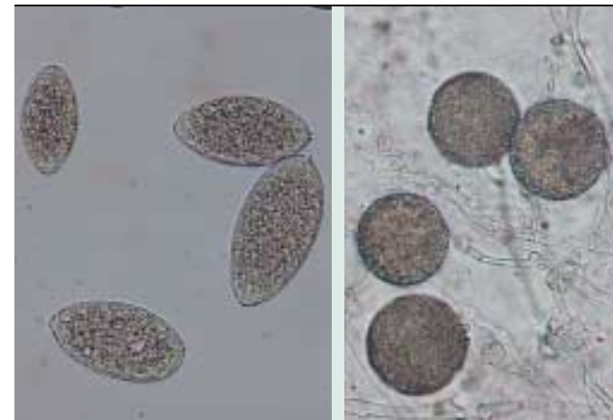
Trosovniki in klamidospore so pomembni za širjenje bolezn.

Phytophthora ramorum ima micelij iz nedeljenih hif. Na hifah nastajajo trosovniki (sporangiji) in v njih zoospore. Trosovniki in zoospore so pomembni pri vegetativnem razmnoževanju, prav tako tudi okrogle klamidospore, ki v velikem številu nastajajo v odmrlih rastlinskih tkivih in omogočajo daljše preživetje organizma.