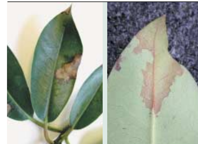
Pege na listih rododendrona