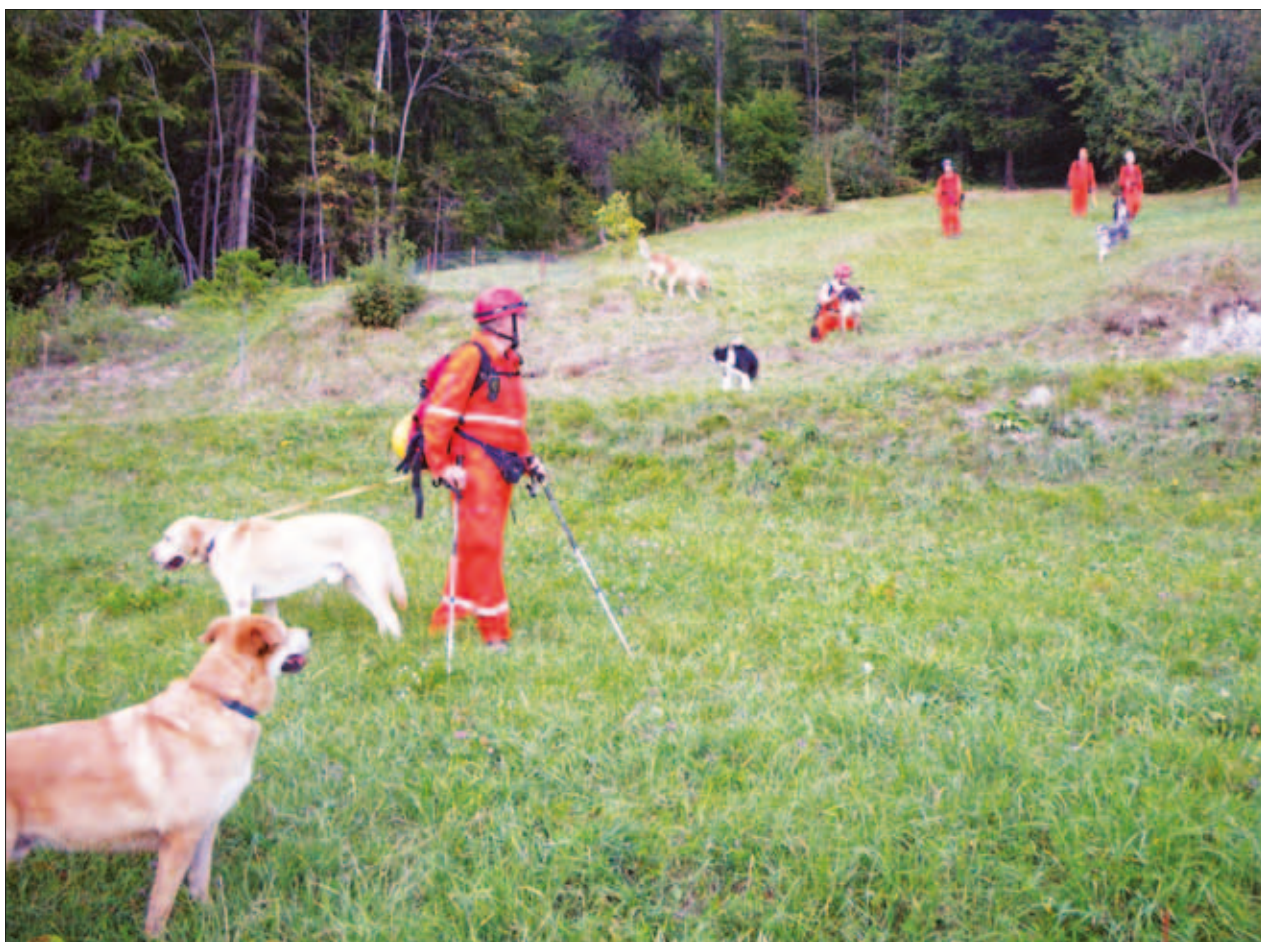
Slika 1: Iskanje pogrešanega z reševalnimi psi.