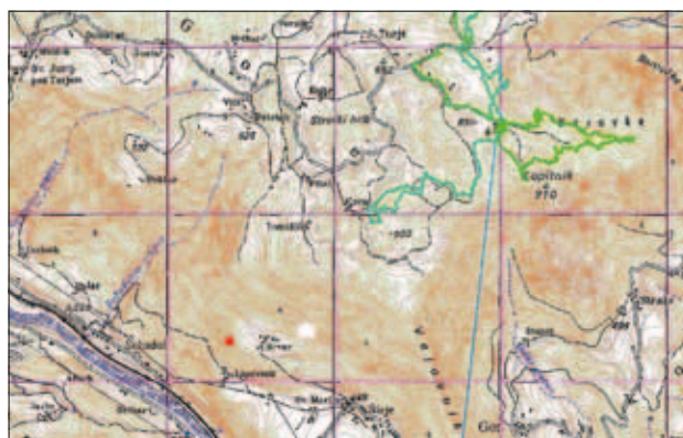
Slika 3: Približna lokacija najdene pogrešane osebe Figure 3: Approximate location of the found missing person.

gozdu našel truplo, za katero je bilo pozneje ugotovljeno, da gre za pogrešanega. Truplo je bilo najdeno približno sedem kilometrov od kraja pogrešanja.