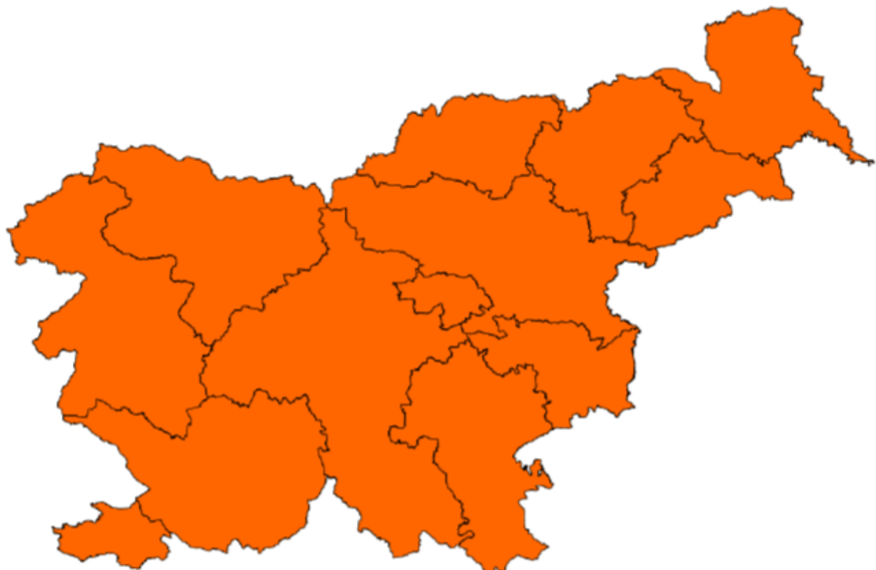
Slika 2: Ogroženost slovenskih regij zaradi pojava nalezljivih bolezni pri ljudeh