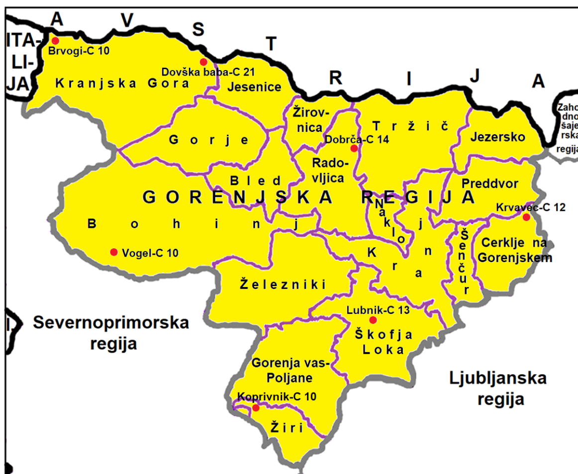
Legenda: Državna meja Regijska meja Občinska meja Repetitorska postaja

Sistem radijskih zvez ZARE je koncipiran tako, da je možno uporabiti določeno število semiduplexnih kanalov (število je določeno s številom repetitorjev, ki so dosegljivi vsem R/p – ročne, mobilne, stacionarne na območju regije) in celoten nabor simpleksnih kanalov, ki si na razpolago v celotnem sistemu. Omejitve obstajajo zaradi konfiguracije terena, tehničnih lastnosti radijskih zvez in zasedenosti kanalov. ReCO Kranj ureja in usklajuje zveze ter posameznim reševalnim službam določa delovne (simpleksne) kanale.