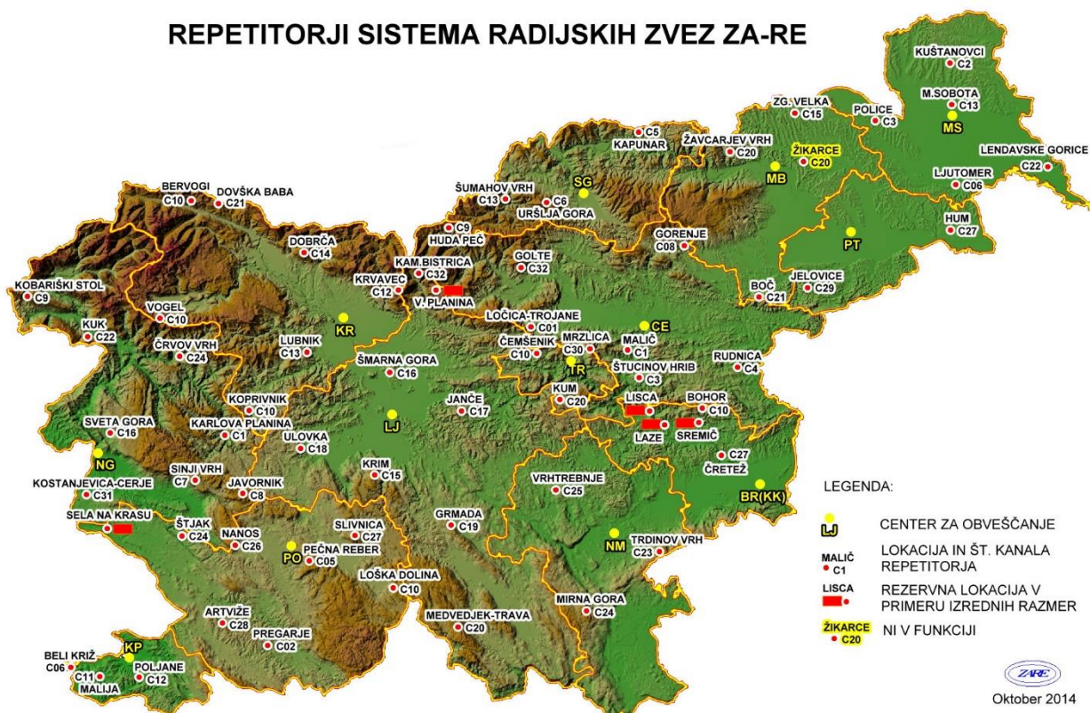
Slika 5: Repetitorske postaje s kanali sistema ZA-RE