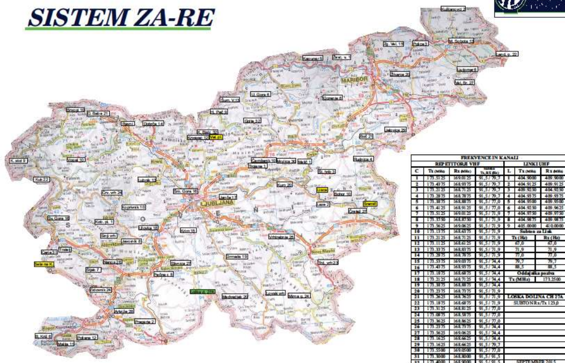
Slika 3: Repetitorske postaje s kanali sistema ZA-RE