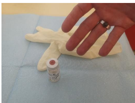
Prstni dozimeter

Za osebni nadzor trenutne obsevanosti na delovišču, kjer je možna večja izpostavljenost, se morajo uporabljati tudi aktivni elektronski alarmni dozimetri, ki delavca z alarmom opozorijo na previsoke hitrosti doz in morebitno previsoko prejeto dozo pri opravljanju dela ter omogočajo takojšnje odčitavanje prejete doze.