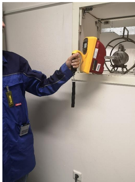
Pravilno nameščen osebni dozimeter in alarmni elektronski dozimeter

Za osebni nadzor trenutne obsevanosti na delovišču, kjer je možna večja izpostavljenost, se morajo uporabljati tudi aktivni elektronski alarmni dozimetri, ki delavca z alarmom opozorijo na previsoke hitrosti doz in morebitno previsoko prejeto dozo pri opravljanju dela ter omogočajo takojšnje odčitavanje prejete doze.