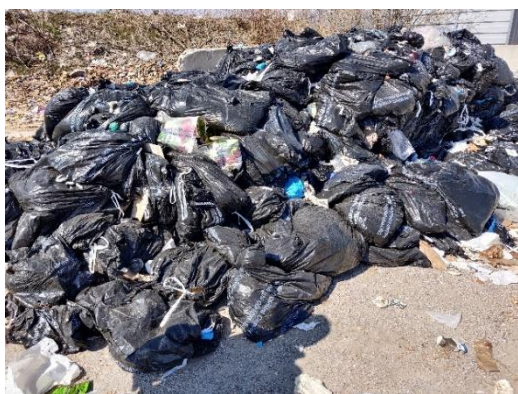
Komunalni bolnišnični odpadki, med katerimi so nekateri kontaminirani

Tri intervencije niso bile povezane s prevozom. Pri prvi intervenciji sta bila v Ljubljani najdena dva vojaška detektorja DR-M3 s pripadajočo opremo, ki vsebuje vir ^{90}\text{Sr} z začetno aktivnostjo 200 kBq. Radioaktivna vira je prevzela ARAO. Dve intervenciji pa sta bili povezani z javljalniki požara z virom sevanja v Murski Soboti.