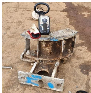
Z ^{226}\text{Ra} kontaminiran predmet, najden na lokaciji SIJ Acroni d. o. o., v tovoru iz Nemčije

Med sedmimi intervencijami, ki so bile povezane s prevozom sekundarnih surovin, so tri, kjer je bil tovor vrnjen v državo izvora in sicer dvakrat v Bosno in Hercegovino in enkrat v Nemčijo. Ena intervencija je bila povezana z zavrnitvijo vagona iz Slovenije v Italiji, vendar je pooblaščenec nato ugotovil, da gre za naravne radionuklide v izolacijskem materialu, ki niso zahtevali ukrepov. Slovenski podjetji sta trikrat izmerili povišano dozno polje na tovoru. Opravljen je bil pregled pooblaščenega izvedenca, vendar v nobenem primeru ni bilo potrebno ukrepanje. Tudi v teh primerih je šlo za naravne radionuklide, ki so povzročali povišano dozno polja in s tem alarme na detekcijskih sistemih.