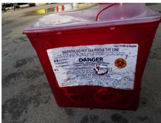
Zabojnik s kontaminiranimi bolnišničnimi odpadki

V letu 2021 je inšpekcija URSJV obravnavala 35 intervencij, večinoma povezanih s prevozi odpadkov. Kar 21 intervencij je bilo povezanih s komunalnimi ali bolnišničnimi odpadki, kontaminirani z radiofarmaceutiki. Ti so prožili alarmne signale na detektorjih v zbirnih centrih za odpadke. Kontaminacija z ^{131}\text{I} , ^{99\text{m}}\text{Tc} in ^{177}\text{Lu} je bila identificirana na robčkih, plenica in podobnih predmetih. URSJV je uvedla sistematično ukrepanje ob takšnih intervencijah, ki vsebuje med drugim zavarovanje tovora, ponovitev meritev po vnaprej predpisanem programu ter tudi, če je to potrebno, pregled pooblaščenega izvedenca in vrnitev tovora zdravstveni ustanovi, od koder so kontaminirani odpadki prišli. V izogib bodočim podobnim intervencijam je URSJV obvestila tudi inšpekcijo Uprave RS za varstvo pred sevanji, ki nadzira uporabo virov sevanj v zdravstvu.