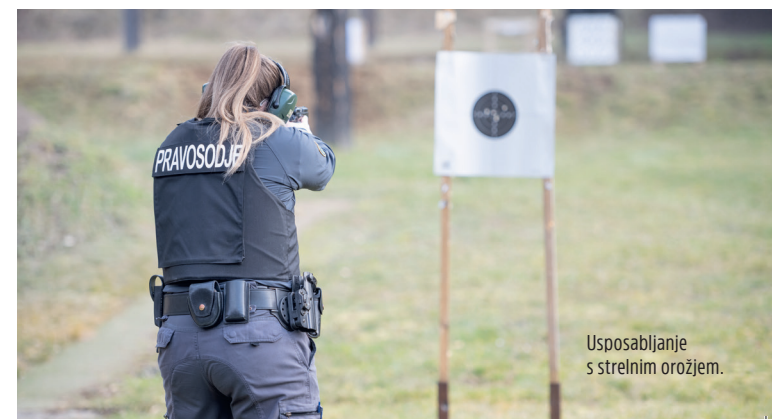
Usposabljanje s strelnim orožjem.