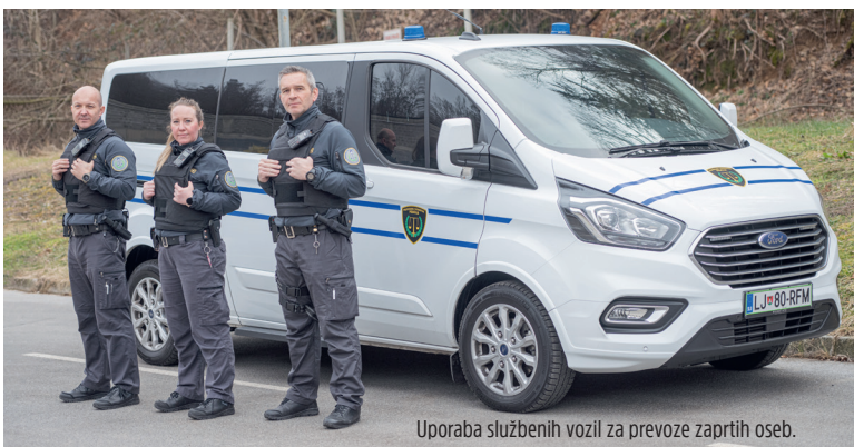
Uporaba službenih vozil za prevoze zaprtih oseb.

Od kandidatov in kandidatke za prosta delovna mesta poleg izpolnjevanje formalnih pogojev pričakujemo predvsem primerne osebnostne značilnosti, da imajo občutek za komuniciranje, empatijo in skupinsko delo.