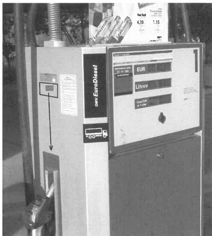
Slika 6: Priprava SLO 00-03-004 z 2 iztočnima pipama. Primer namestitve overitvenih oznak po točki (3) iz člena III.