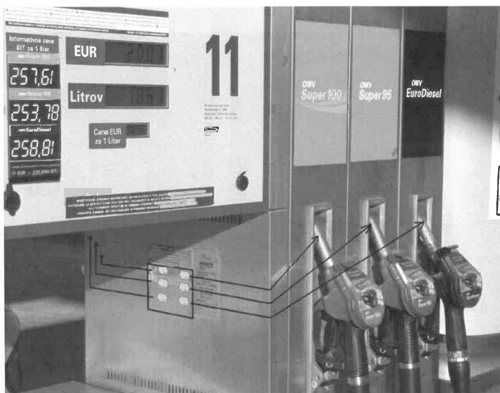
Slika 4: Priprava SLO 00-03-004 s 6 iztočnimi pipami. Primer namestitve overitvenih oznak po točki (3) iz člena III