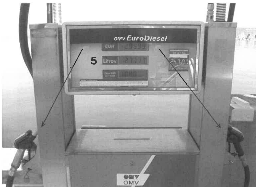
Slika 1: Priprava SLO Z-05-01 z 2 iztočnima pipama. Primer namestitve overitvenih oznak po točki (2) iz člena III.