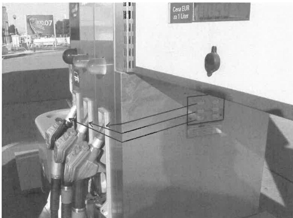
Slika 5: Priprava SLO Z-05-02 s 6 iztočnimi pipami. Primer namestitve overitvenih oznak po točki (3) iz člena III.