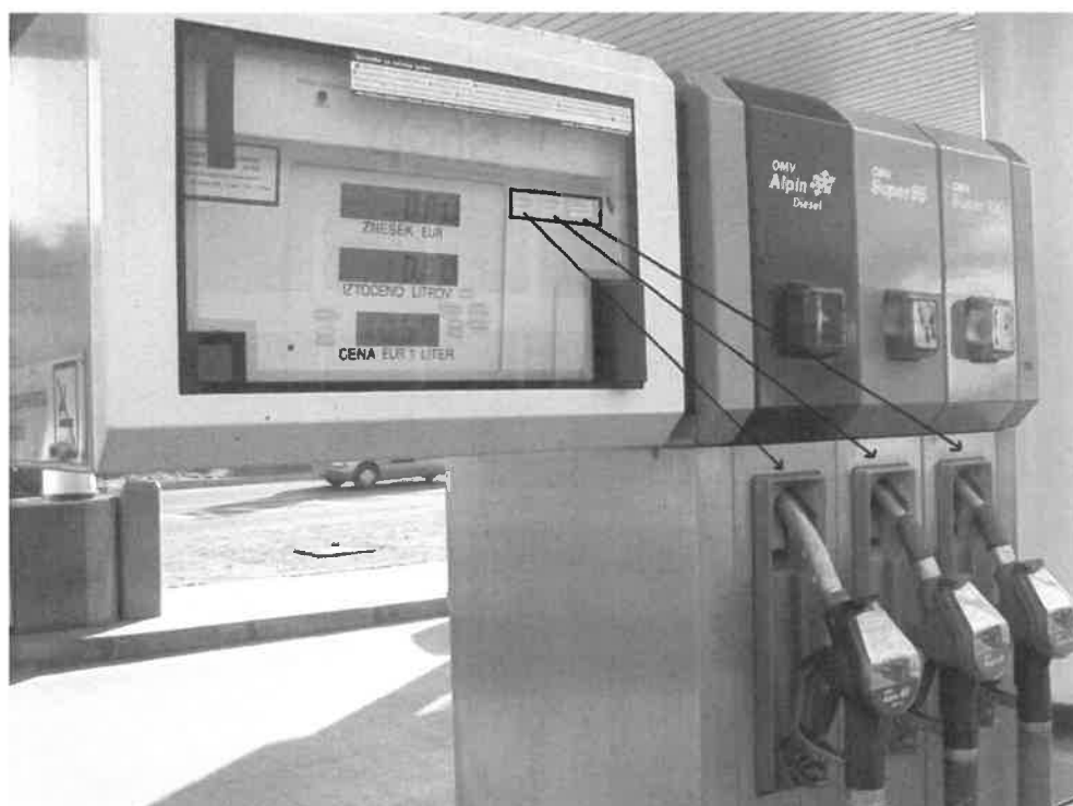
Slika 2: Priprava SLO Z-05-01 z 6 iztočnimi pipami. Primer namestitve overitvenih oznak po točki (2) iz člena III.