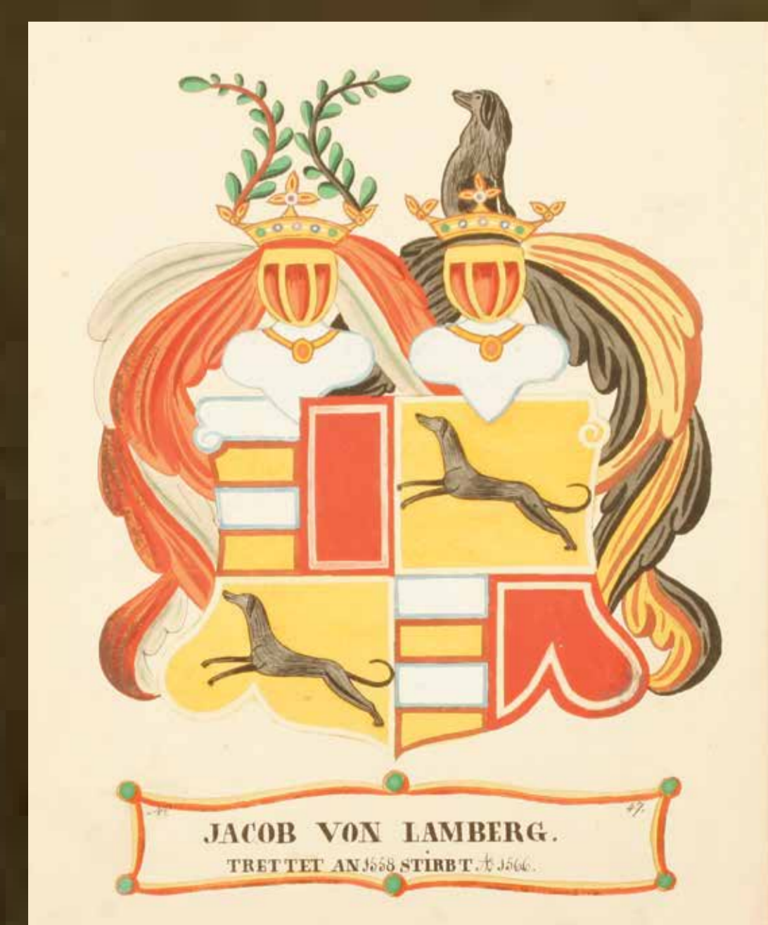
Grb Jakoba pl. Lamberga, s. d.

SIAS 176, Franciscejski kataster za Kranjsko, k. o. Slivnica, N 253, A 04