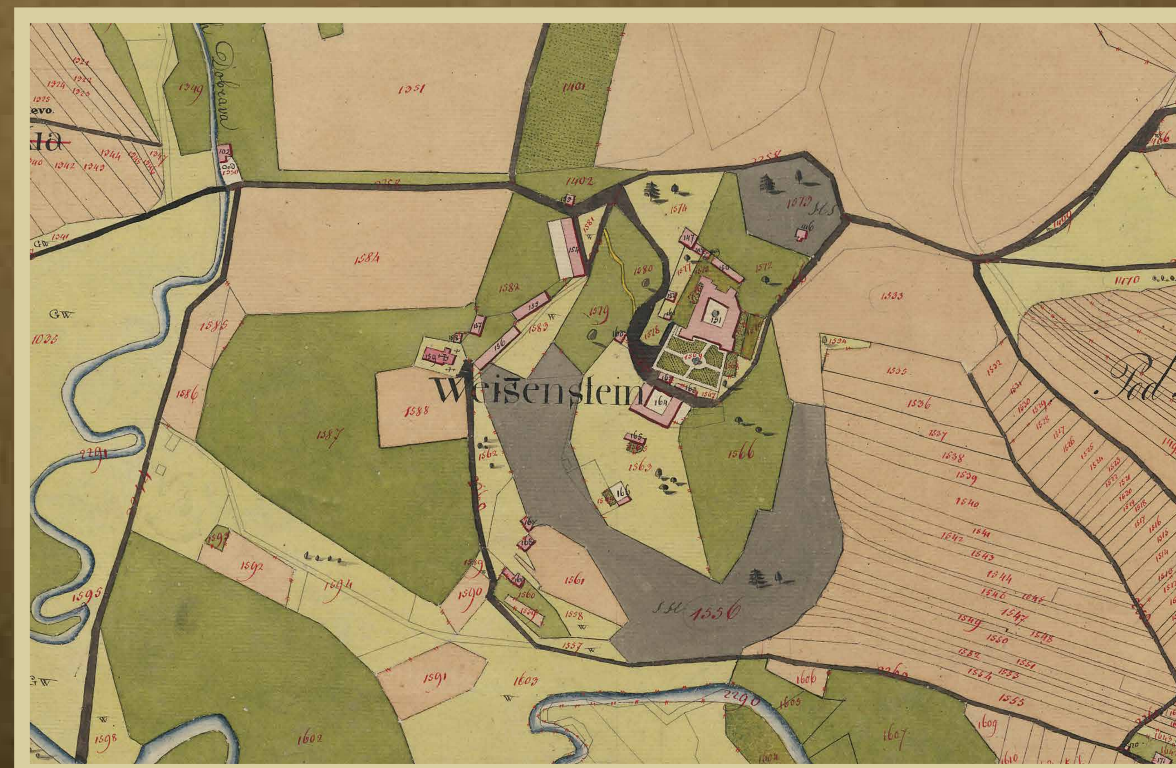
Legra gradu Boštanj pri Žalni v franciscejskem katastru za Kranjsko, 1823

SIAS 1100, Cesarsko-kraljevi spomeniški urad, sk. 16, p. e. II/309