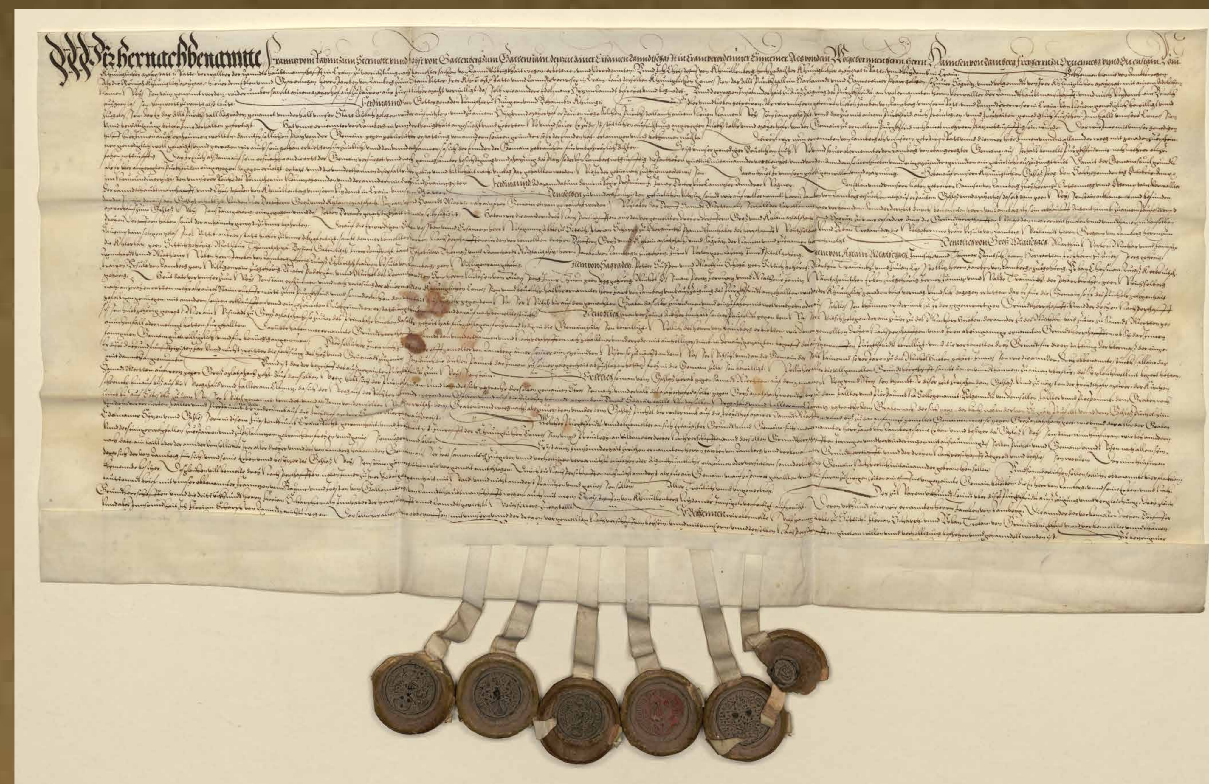
Določitev pomirja gospostva Boštanj pri Žalni, 16. 5. 1553