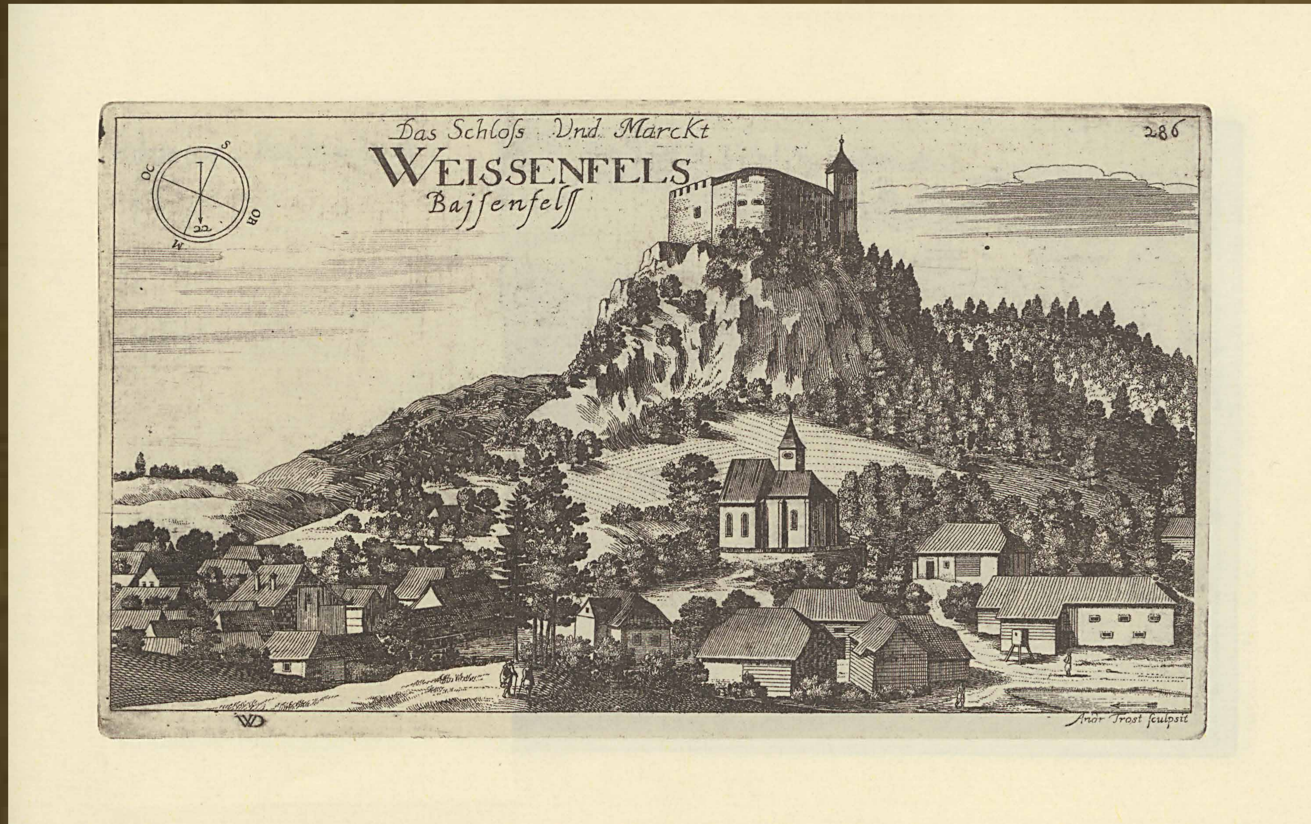
Grad Bela peč J. V. Valvasor, Topographia Ducatus Carnioliae modernae , Faksimilirana izdaja, Ljubljana 1995