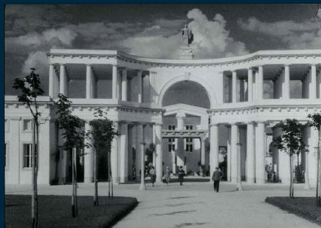
Vhod v Žale, fotografija iz filma ob otvoritvi. (SI AS 1086, t. e. 10)