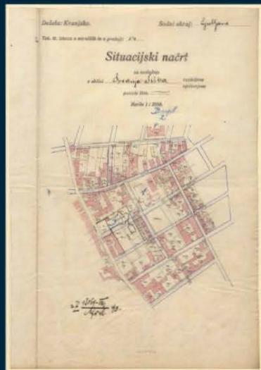
Zemljevid morebitnih lokacij za novo šišensko cerkev po prvotnem gradbenem projektu iz leta 1913. (SI AS 73, VI-4, Cerkev sv. Frančiška v Spodnji Šiški, mapa 3)