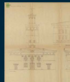
Nepotrjen Plečnikov načrt z drugačnim vhodnim pročeljem in zvonikom. (SI AS 73, VI-4, Cerkev sv. Frančiška v Spodnji Šiški, mapa 2)