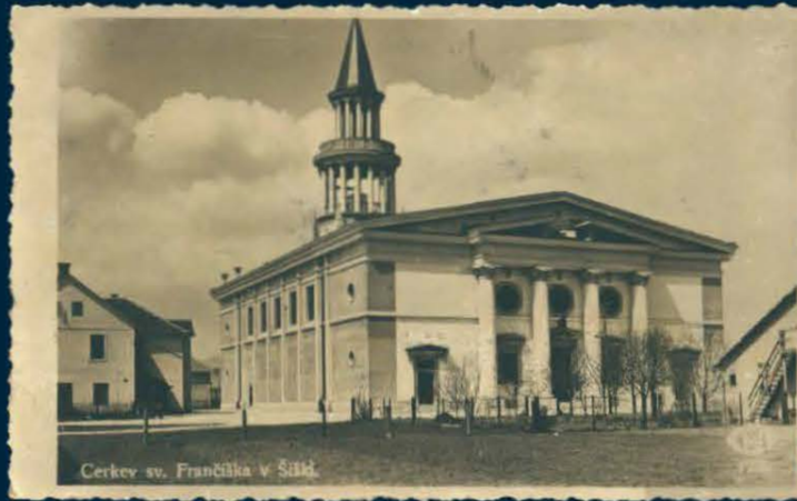
Cerkev sv. Frančiška v Šiški

Cerkev sv. Frančiška Ašičkega v Spodnji Šiški po zaključku vseh zunanjih gradbenih del. (SIAS 7085, p. e. 80, mapa 74)