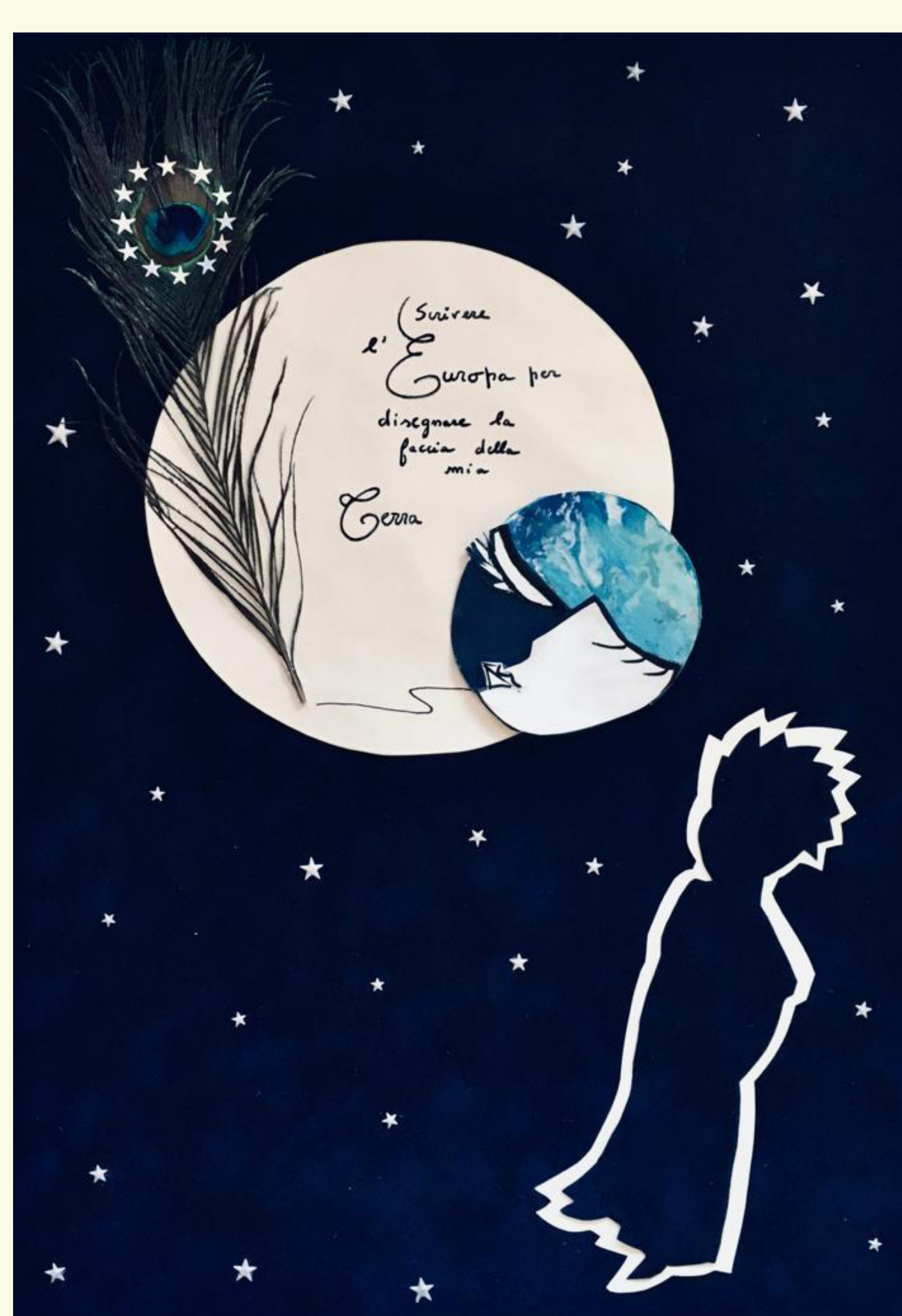
Francoska srednja šola, izobraževalni program HAEU, januar 2020.