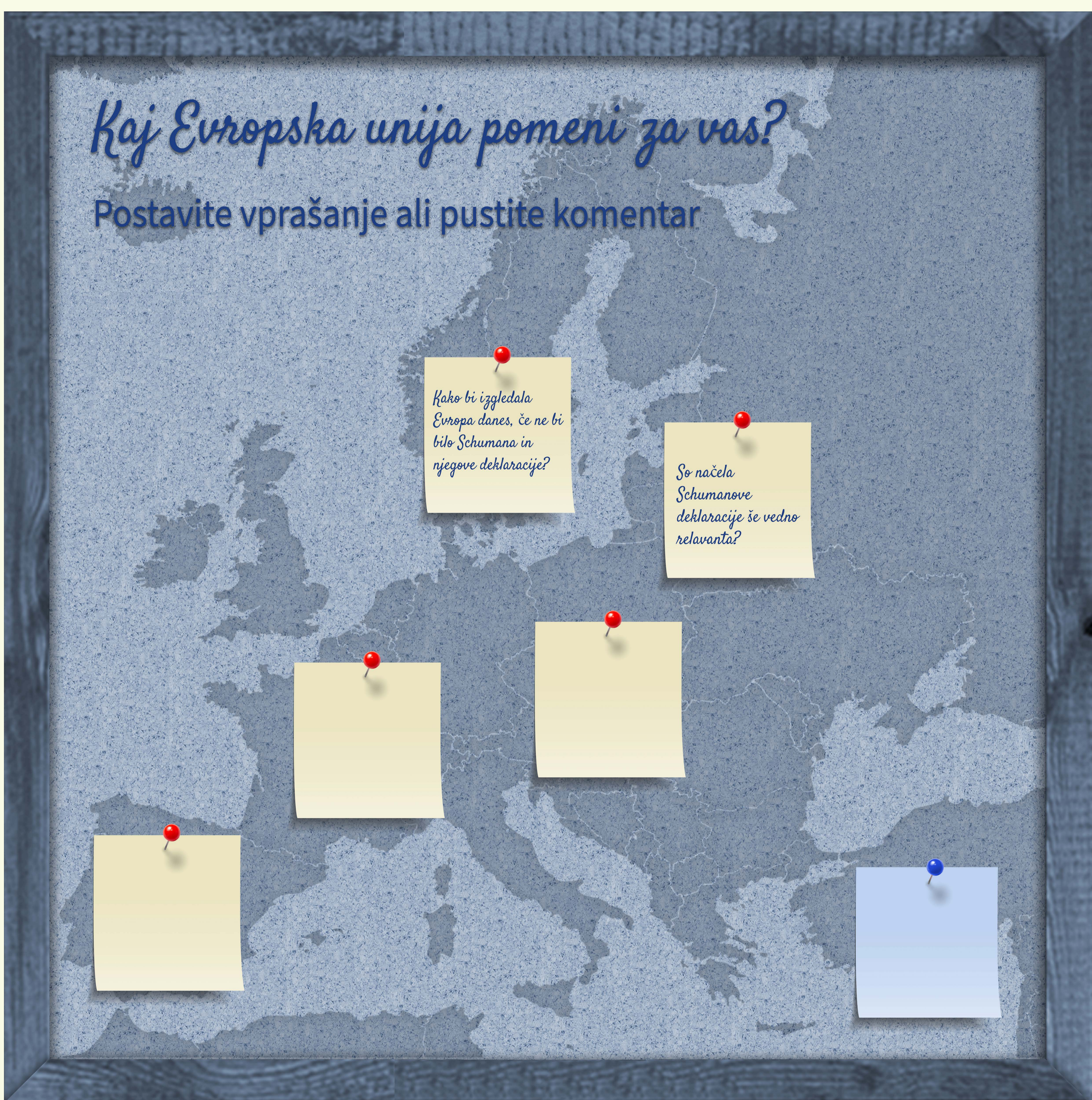
Italijanska srednja šola, izobraževalni program HAEU, november 2019.

“Evropska unija je zame kot luna, skoraj vedno vidna, vedno prisotna, zdi se kot da ne dela nič pomembnega, vendar pa v resnici neposredno prispeva k našemu dobrobitu, ne da bi kdo sploh opazil.”