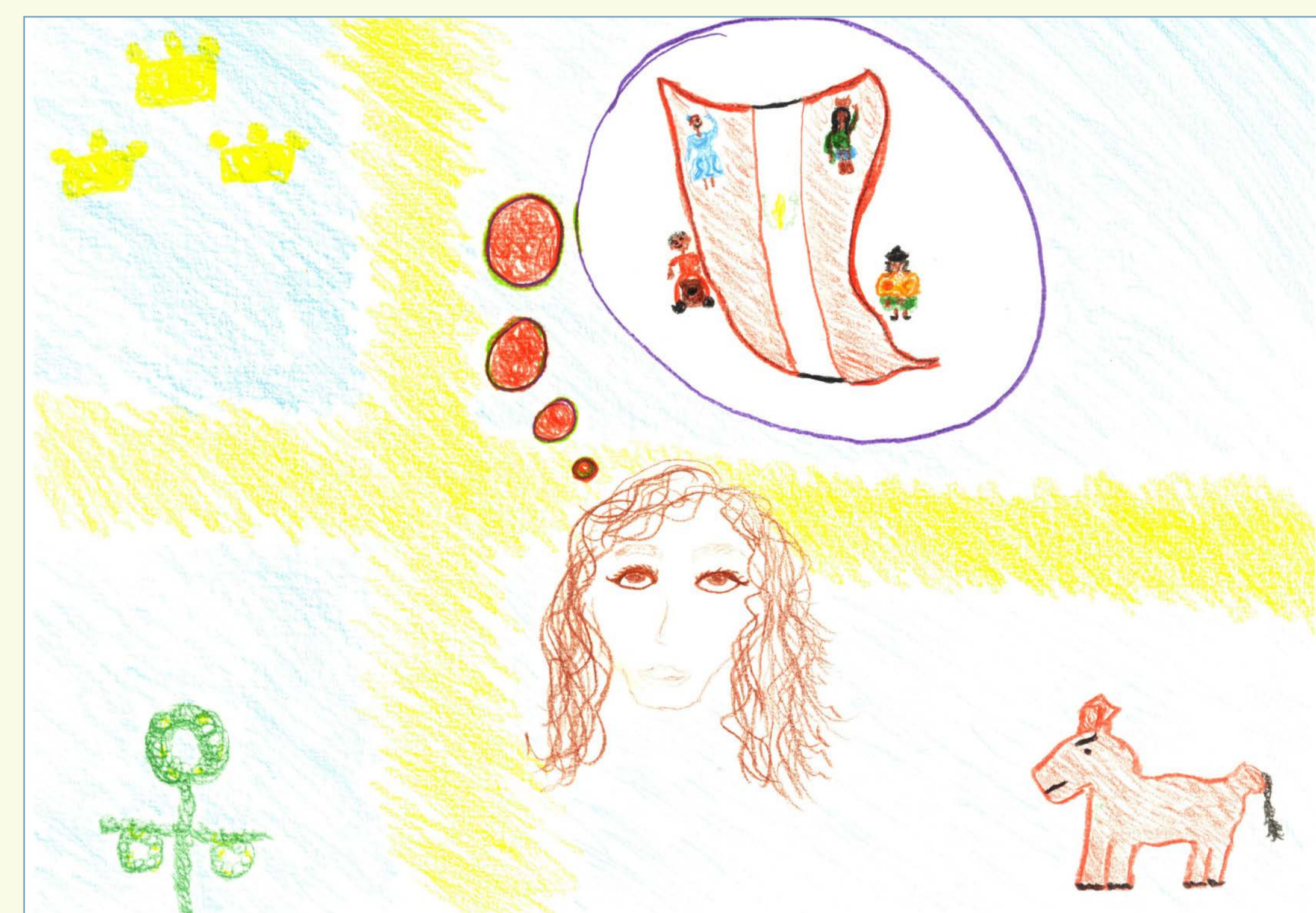
F. (pseudonim), vizualni prikaz multikulturnih korenin. Stockholm, avgust 2016.