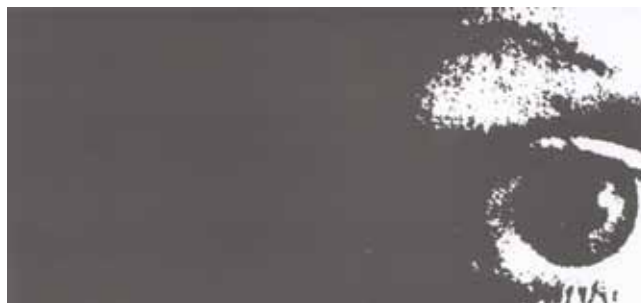
Fotografija iz filma Do spoznanja

Slovenija, 1975, barvni, 30' Nejč Slapar