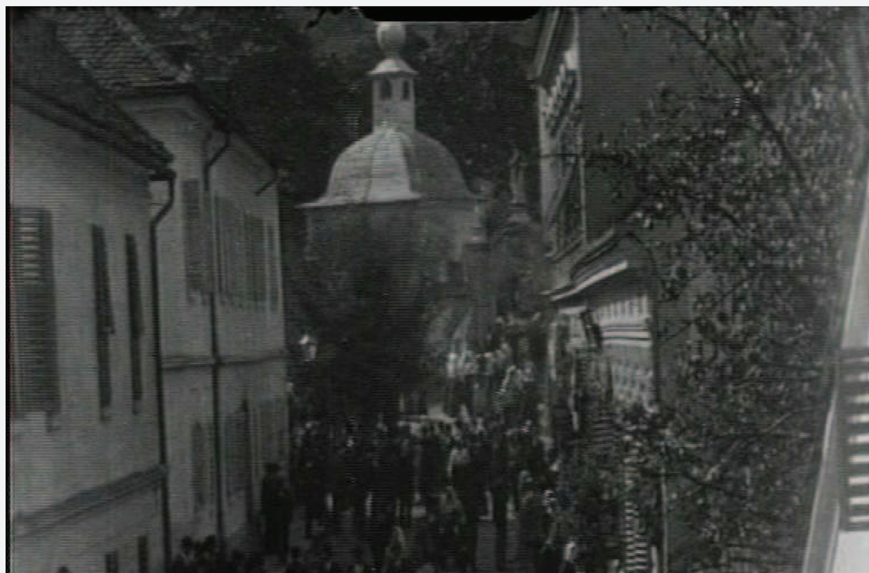
Odhod od maše v Ljutomeru, 1905 (SI AS 1086/237)