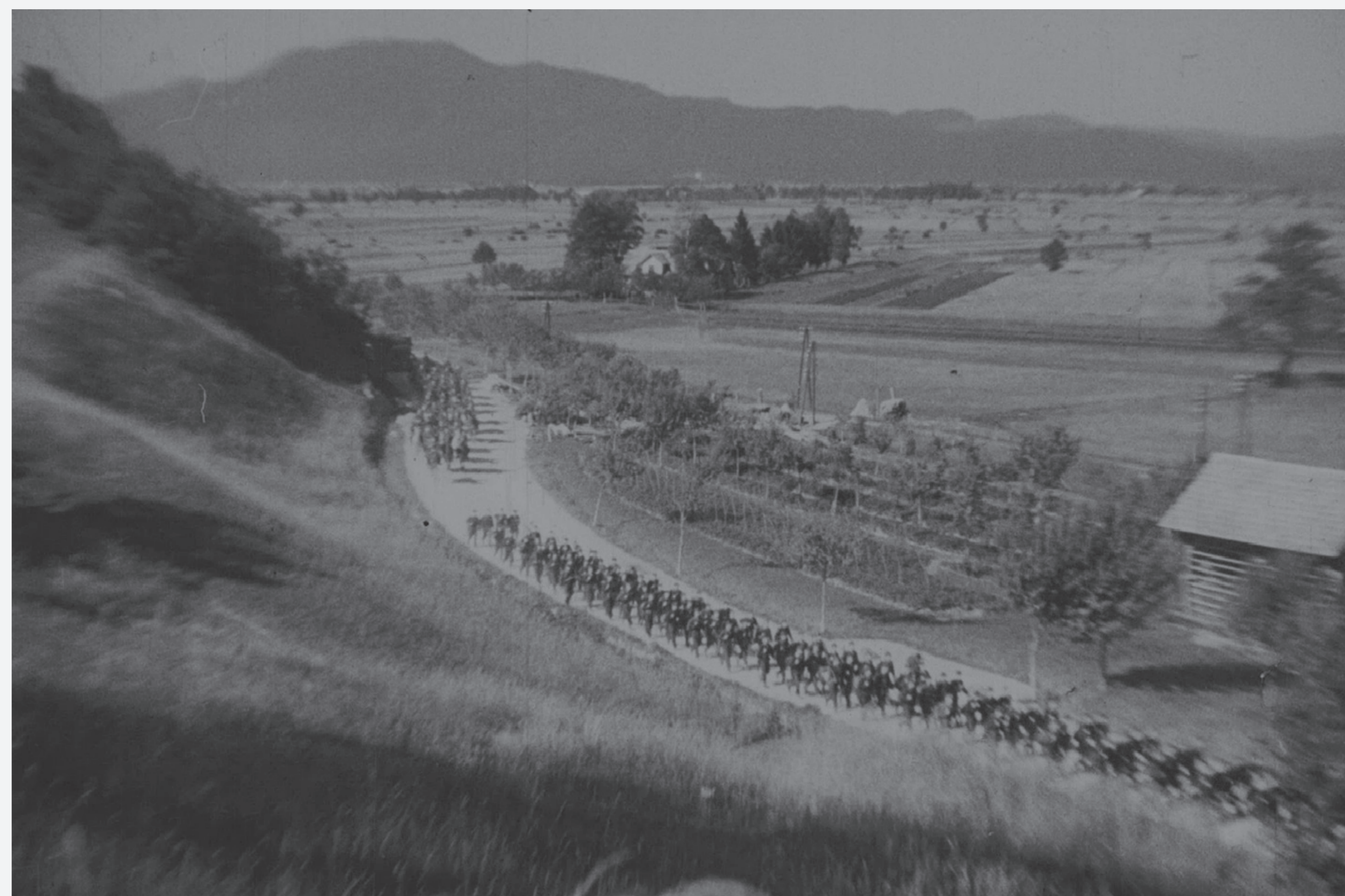
Prihod partizanov po Dolenjski cesti v Ljubljani, 1945