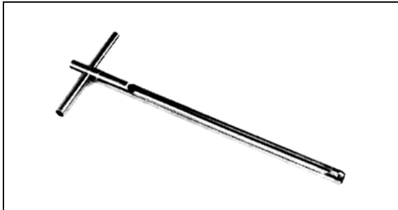
Slika 1. Sonda za jemanje talnih vzorcev